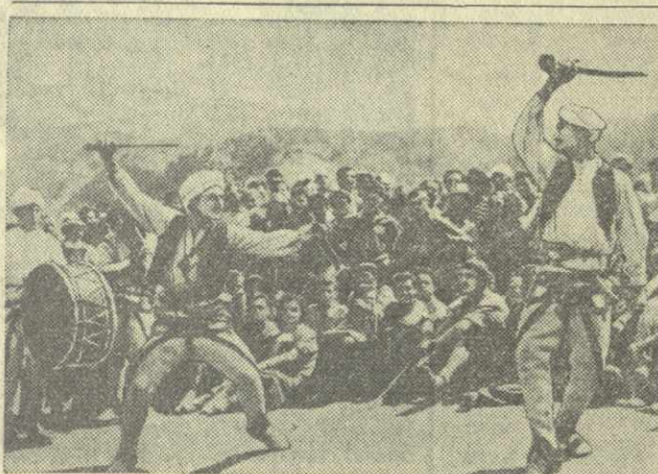
Федеративная Народная Республика Югославия. Недавно в Сербии в горах «Прокац» состоялся традиционный сбор югославских альпинистов. В нем участвовало около 4.000 спортсменов. На снимке: на заключительном празднике альпинистов. Представители местного населения исполняют народный танец.

Материалы, вывезенные Раковичем из Антарктики, опубликованы им более чем в 60 трудах.