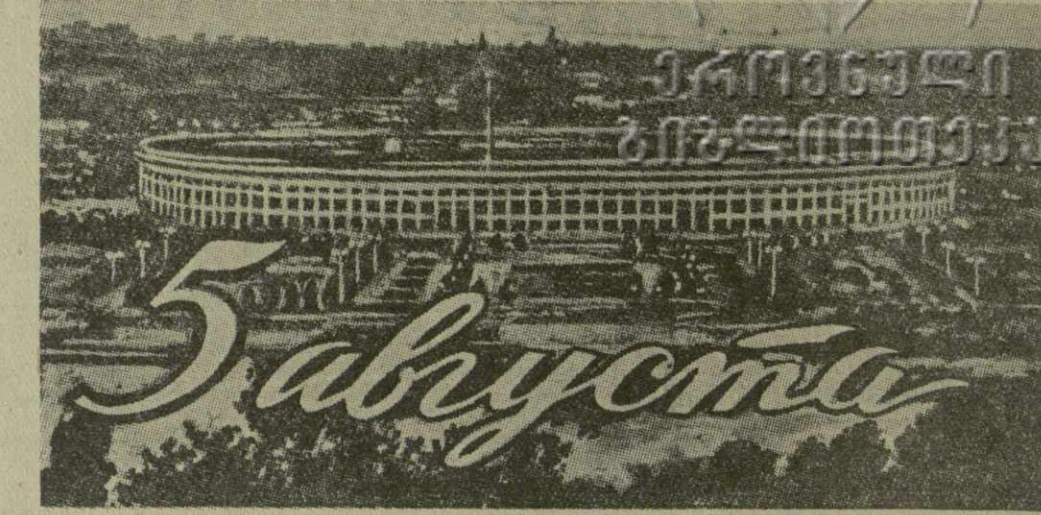
На снимке: вид на центральный стадион в Лужниках с Ленинских гор вечером.

Киев—Минск—Москва, результаты которой входят в общекомандный зачет. В связи с тем, что мужская и женская сборные волейбольные команды СССР должны в августе выехать в Париж для участия в чемпионате мира, начались игры волейболистов. Со 2 августа начнутся предварительные встречи по футболу и теннису.