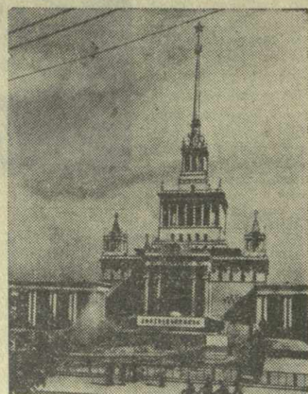
Китайская Народная Республика. Шанхай. Дворец китайско-советской дружбы.

Как сообщает югославская газета «Политика», недавно 4-я батарея коксохимического комбината в Зенице дала первые тонны кокса. С пуском в действие этой батареи вступил в строй все производственный мощности самого крупного в Югославии комбината, который будет давать стране 580 тысяч тонн кокса в год.