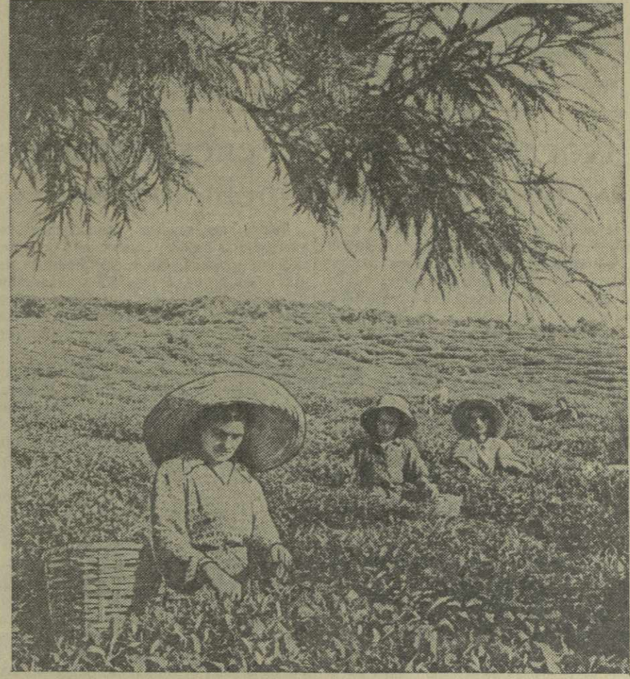
Знаменский колхоз имени Орджоникидзе Махарадзевского района. На снимке: вторая чаеводческая бригада, взявшая обязательство собрать в этом году 54 тонны зеленого чайного листа. На 13 августа бригадой собрано 49 тонн.