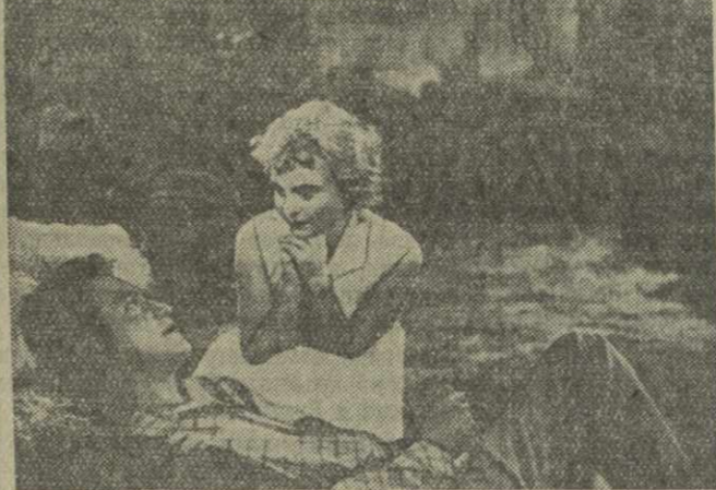
Кадр из кинофильма «Тропую грома».

стствующий между белыми колонизаторами и угнетенными цветнокожими.