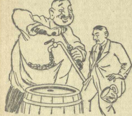
«Рационализаторы» из пивного зала... Рис. Г. Ломидзе.

Мы же зашли в пивной зал 14 августа, три недели спустя после этого случая. На глазах участников рейда продавец Г. Шалибашвили недолго гражданину Р. Микадзе, взявшему две кружки, 220