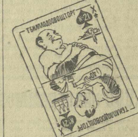
Днем и ночью... Рис. Г. Ломидзе.

С 1 августа было проведено снижение цен на ряд товаров широкого потребления. По заказу Тбилищторга типографским способом был напечатан список товаров, на которые были снижены цены. Но — странное дело! — преysкурант не включает в себя целый ряд товаров, которых коснулось это снижение. Заведующий отделом организации торговли тов. А. Аласания сказал нам, что не было надобности указывать весь список, поскольку... преysкурант получился