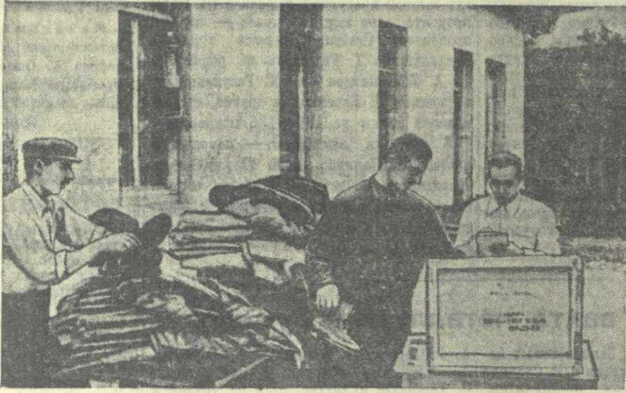
На снимке: работники Пасанаурского сельпо готовят зимнюю одежду для чабанов млетского колхоза.

— Об этом, Шно, не беспокойся, — заверяет председатель колхоза, — через