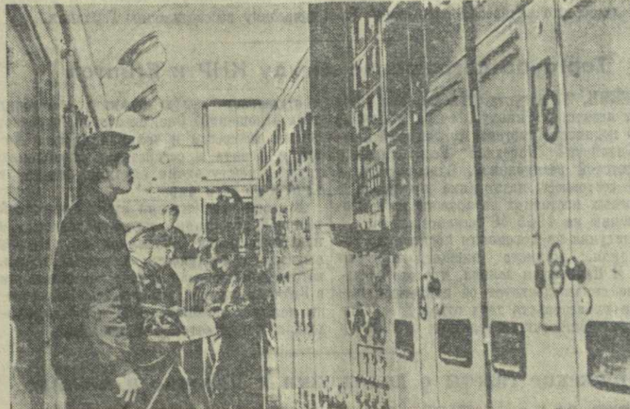
Китайская Народная Республика. В городе Цзямыси (провинция Хэйлуцзян) построена электростанция. Оборудование для нее поставлено предприятиями Советского Союза. На станции установлена различная аппаратура и приборы, осуществляющие автоматический контроль за работой агрегатов. На снимке: щит управления на новой электростанции.

Задачи первой пятилетки обширны. Необходимо создать основы тяжелой промышленности, расширив в несколько раз выплавку чугуна, стали, выпуск проката, машин и оборудования для строящихся предприятий. Нужно также развивать новые для Китая отрасли промышленности — тракторную, автомобильную, авиационную, химическую, паровозо- и судостроительную, шарикоподшипниковую, моторостроение, производство электророборудования и