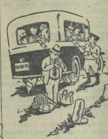
Рис. худ. А. Кандалаки.

Министерству автомобильного транспорта и шоссеиных дорог Грузинской ССР следует проверить работу Тбилисской автостанции и принять необходимые меры к тому, чтобы улучшить обслуживание курортников пригородной зоны.