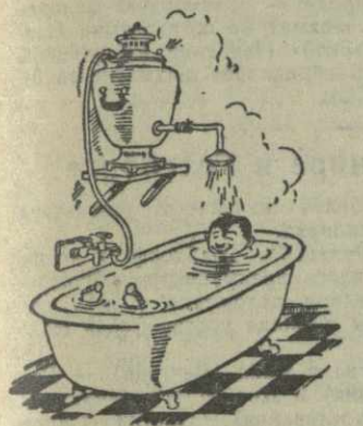
Рис. худ. А. Кандалаки.

Совершенно неудовлетворительно качество настила полов; дощечки паркета высыпаются из своих гнезд. При ходьбе паркет издает такой скрип, что жильцам нижних этажей нет покоя.