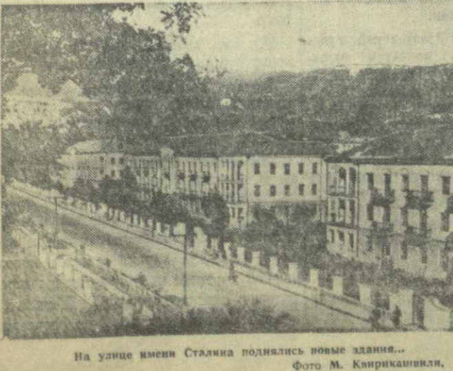
На улице имени Сталина возведены новые здания.