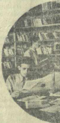
Как всегда, в библиотеке шахты имени Сталина много читателей.

На днях из Москвы было получено радостное сообщение. По показателям работы за июль во Всесоюзном социалистическом соревновании тресту присуждена третья премия в размере 50 тысяч рублей. Шахте имени Ленина присуждена вторая, а шахте имени Сталина — третья денежные премии. Разработка месторождения угля методом гидравлической закладки значительно повысила общие показатели шахт и шахтных участков. Многие шахтеры стали мастерами разработки угля методом гидравлической закладки. Содействует