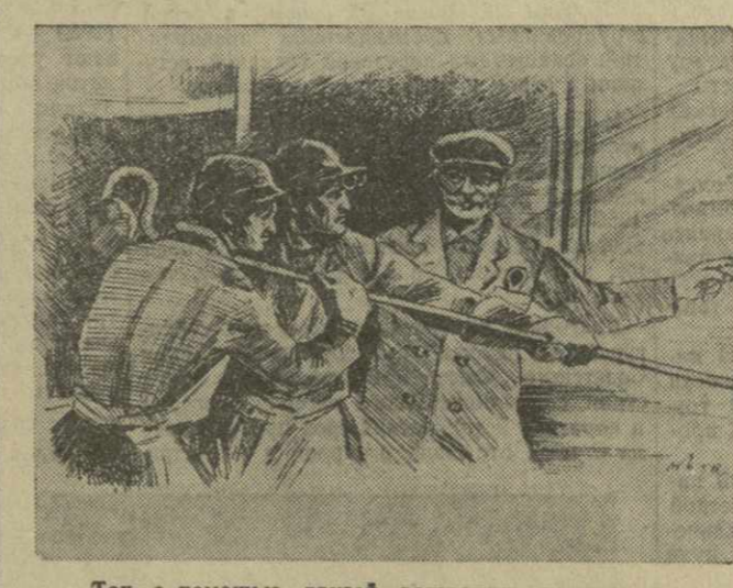
Так, с помощью друзей рождалась первая плавка... Рисунок худ. О. Сехинашвили.

Так, с помощью друзей рождалась первая плавка... рено идет к новым успехам коммунистического строительства. Более 20 лет работаю я в трикотажном цехе Сухумского горпромкомбината. За этот период произошли большие изменения не только на нашем комбинате, но и во всей республике. За это время я овладею тремя профессиями. В этом мне помог опыт трикотажников Грузинской ССР и РСФСР. Сейчас работаю бракером-контролером. Дружба народов скрепила и производственную дружбу, которая растет и крепнет среди рабо-