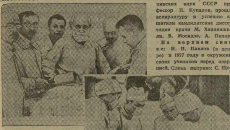
Великий русский ученый И. П. Павлов оказывал большую помощь ученым всех братских республик нашей Родины. Под его непосредственным руководством...