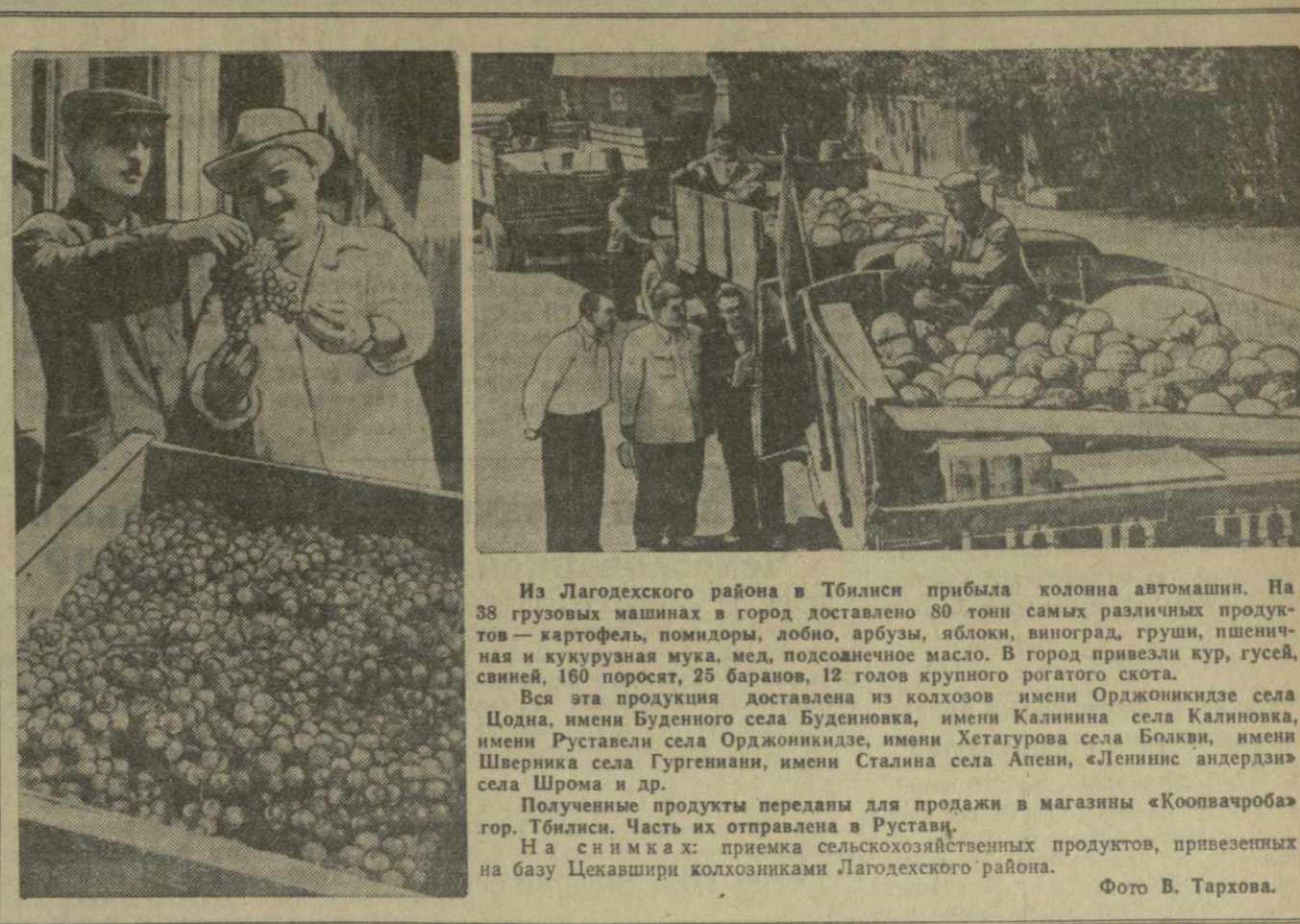
Из Лагодехского района в Тбилиси прибыла колонна автомашин. На 38 грузовых машинах в город доставлено 80 тонн самых различных продуктов — картофеля, помидоры, дыни, арбузы, яблоки, виноград, груши, пшеничная и кукурузная мука, мед, подсолнечное масло. В город привезли кур, гусей, свиней, 160 поросят, 25 баранов, 12 голов крупного рогатого скота.

Работа в сельпо стоит «на должной высоте». Рис. Г. Ломидзе.