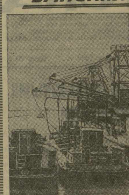
Алтайский край. На снимке: на Барнаульском комбинате. Погрузка из башки зерна, доставленного по Оби районом освоения целинных и залежных земель.

Коллектив Бобруйского машиностроительного завода осваивает производство новой машины — углоса «10УВТХ2», предназначенного для добычи угля гидравлическим способом. За час этот агрегат будет выбрасывать из забоя на высоту 250 метров 900 кубометров угля.