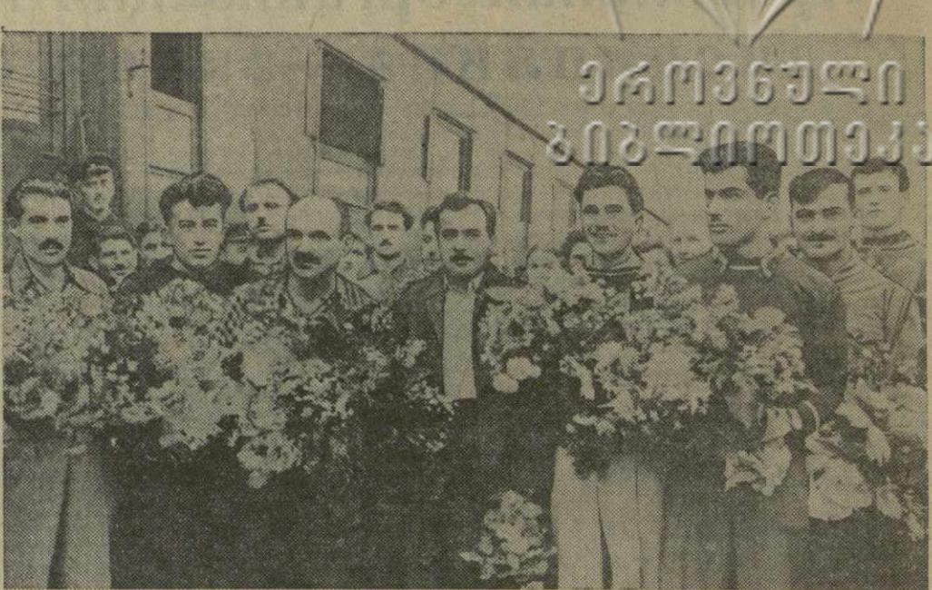
Вчера столица нашей республики встретила отважных альпинистов — участников высотной Памирской экспедиции Грузинского альпийского клуба, совершивших первовосхождение на одну из высочайших и труднодоступных вершин страны — пик «Москва» (6.785 метров).