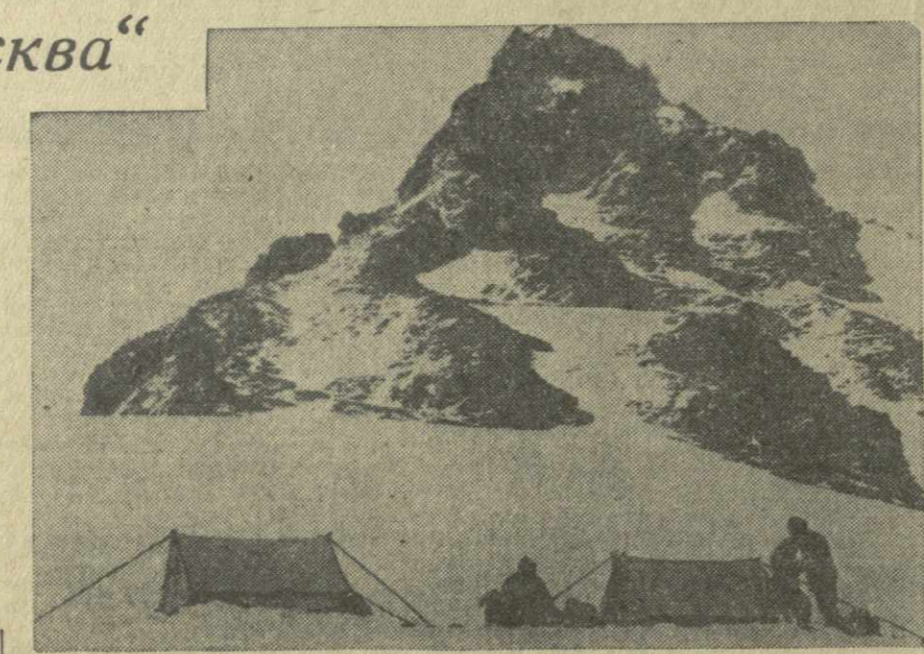
На снимке: верхняя подушка северо-западного гребня пика «Москва». Впереди палаток виднеется отсыпанный «жандарм» пика. Здесь альпинисты разбили лагерь на пути к вершине.

Растапливая снег на примусе, готовим тут лишь кисель. Даже наши любимые голубцы вымазывают на этой высоте отвращение. Насильно закиваем друг друга в рот изюм. ... — Копенгаген, Канр, Кутанси, Курск, Кировабат, Краматорск, Кишинев... — громко доносится из одной палатки в другую — играем в «горда». А когда надоедает эта игра, сражаемся в «бб». ... — Хватит, ребята, пора спать! — кричит из соседней палатки начальник, и мы беспрекословно подчиняемся ему — ведь мы «штурмовики».