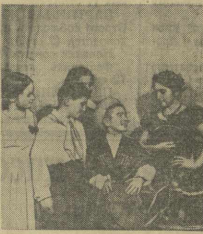
В празднично украшенном помещении 47-й тбилисской средней школы состоялся вечер, посвященный дружбе народов Советского Союза и предстоящему VI Всемирному фестивалю молодежи в Москве.

В подготовке и проведении этого вечера приняла участие не только хозяйка, но и учащиеся других тбилисских школ — 48-й и 45-й русских, 40-й армянской.