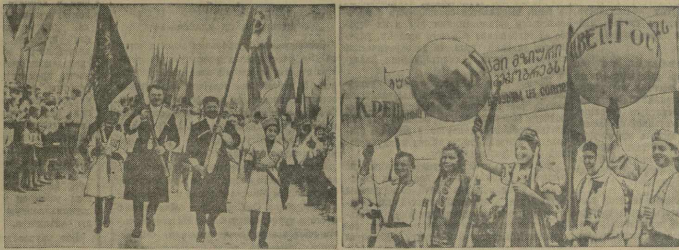
Парад дружбы в городе Генчиске. Слева — делегация трудящихся Махарадзевского района, справа — трудящиеся Генчиского района.