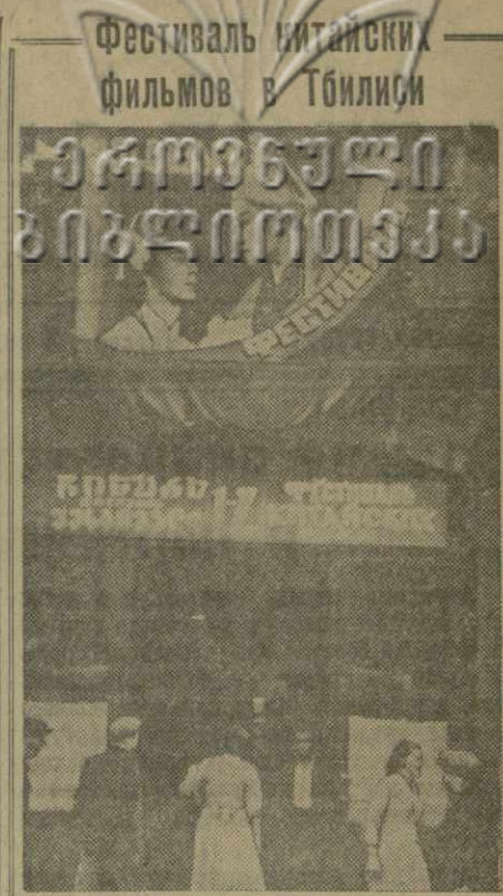
С 1 по 7 октября в кинотеатре «Спартак» проводится третий фестиваль китайских кинофильмов, приуроченный к празднованию седьмой годовщины провозглашения Китайской Народной Республики.