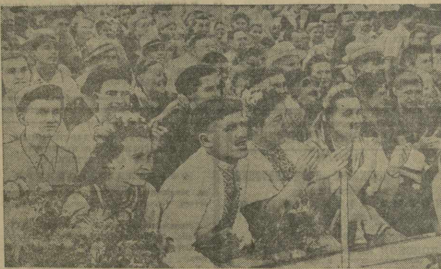
Трудящиеся города Генчиска наблюдают на стадионе «Колхозник» за выступлением ансамбля песни и танца при Доме культуры Махарадзевского района.