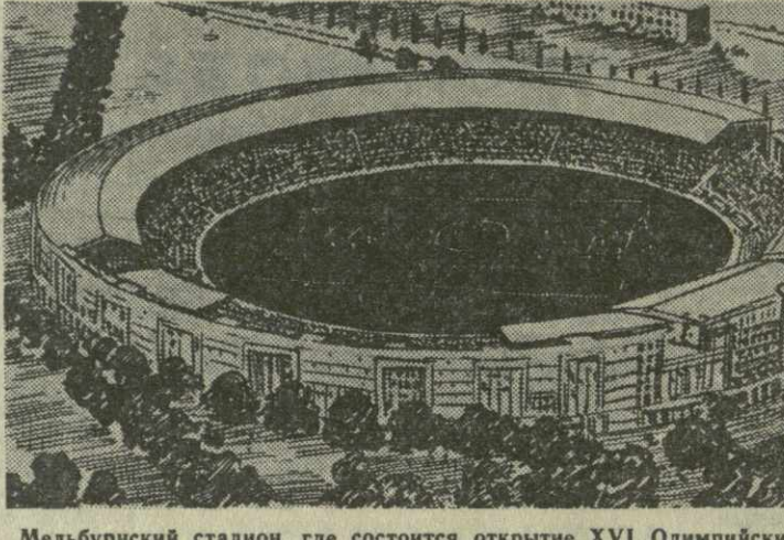
Мельбурнский стадион, где состоится открытие XVI Олимпийских игр.

Для радиорепортажей дается возможность вести передачу с Австралийской радиостанции. Радиокорреспонденты будут иметь здесь свои студии. Можно будет вести передачу и по радио-телефонному кабелю через Лондон с дальнейшей трансляцией в свои страны. Создано также агентство спортивных фотокорреспондентов «ПУЛ». Из Мельбура фотосъемки можно будет передавать по бильдапарту.