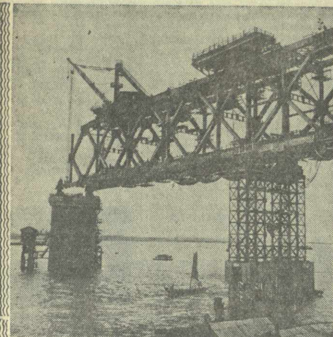
Китайская Народная Республика. На снимке: первый пролет нового моста, сооружаемого через реку Янцзы в Ухани. Общая протяженность его составит 1 километр 440 метров.