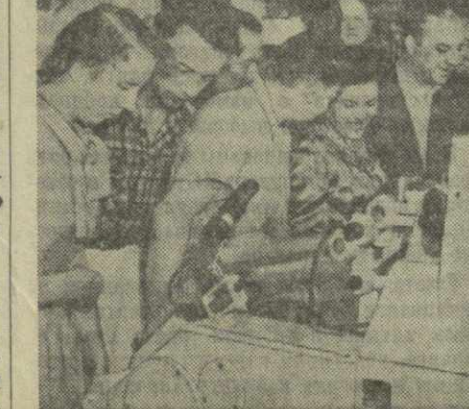
Москва. На выставке «10 лет народно-демократической Чехословакии» в Центральном парке культуры и отдыха имени Горького. На снимке: посетители наблюдают за работой шелкоткацкого станка, установленного в одном из павильонов.

В настоящее время чехословацкое машиностроение выпускает сотни тысяч различных первоклассных станков, агрегатов и других изделий.