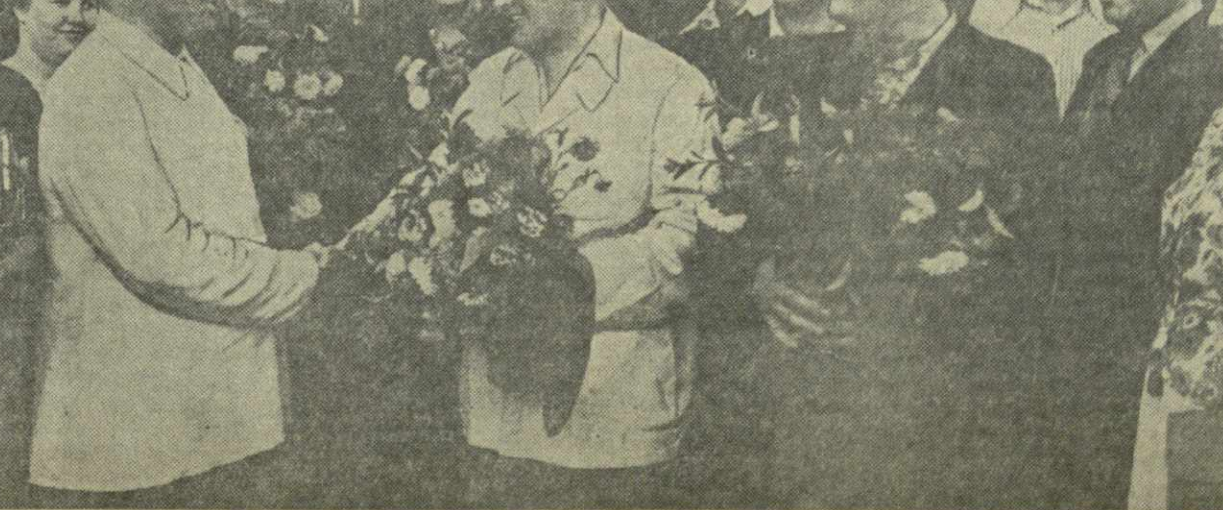
На снимке: встреча делегации металлургов Сталино на тбилисском вокзале.

Вчера же вечером делегация металлургов Сталино прибыла в Рустави. Здесь она проведет несколько дней.