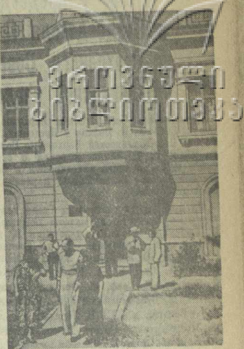
Рустави. Краеведческий музей.