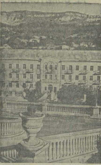
Тквибули. Здание школы ФЗО на улице Сталина.