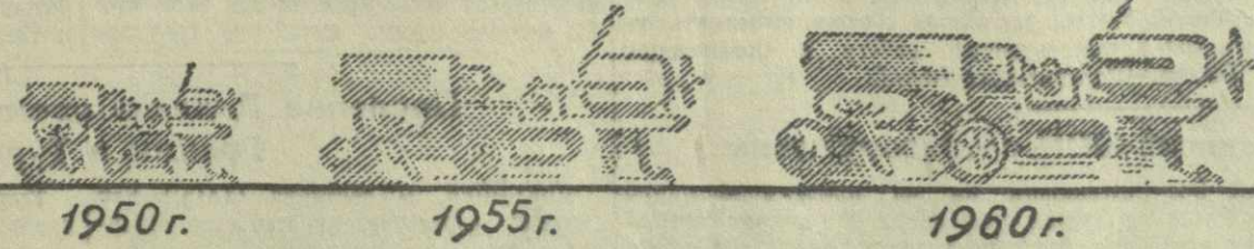
Рост выпуска станков на Тбилиском станкостроительном заводе имени С. М. Кирова. (В 1955 году — в 2,5 раза и в 1960 году — в 3,9 раза больше по сравнению с 1950 годом).