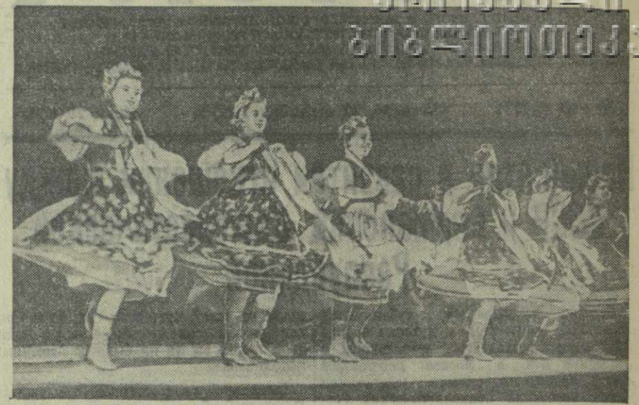
На снимке: выступление танцевальной группы Государственного украинского Закарпатского народного хора.

На юбилейные торжества, посвященные 250-летию со дня рождения Д. Гурамишвили, приглашены гости из Москвы, Ленинграда, Киева, Миргород, Мисска, Баку, Еревана, Петрозавода, Ала-Аты, Фрунзе, Ташкента, Риги, Вильнюса, Таллина, Кишинева, Сталинабада, Ашхабада, Дагестана, Северной Осетии, Кабарды, Адыгейской и Черкесской автономных областей.