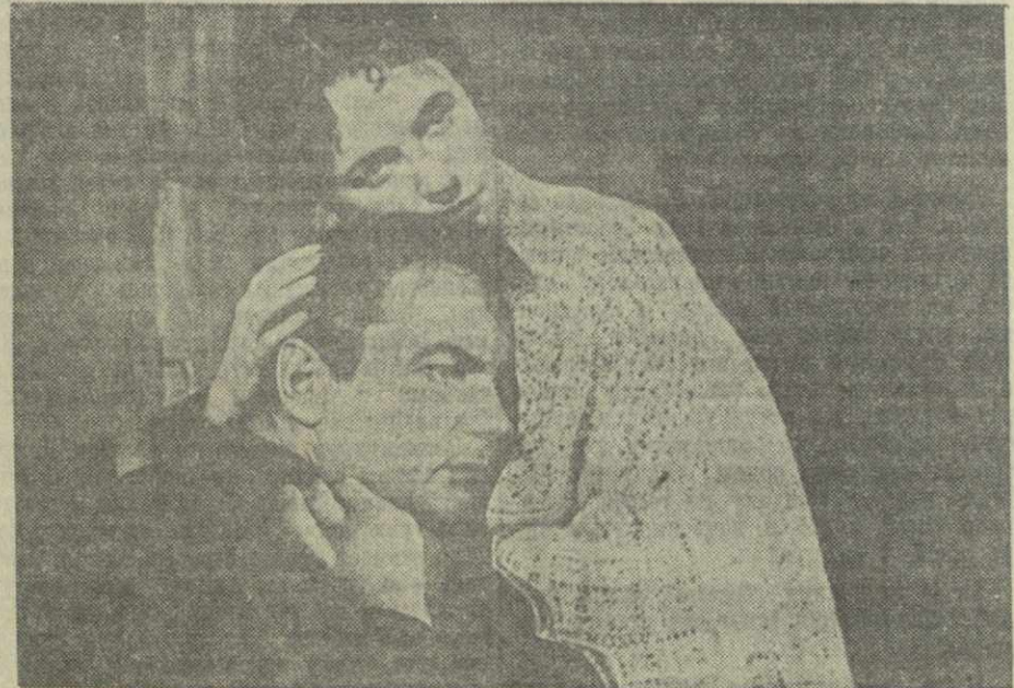
Кадр из кинофильма «Урок жизни».