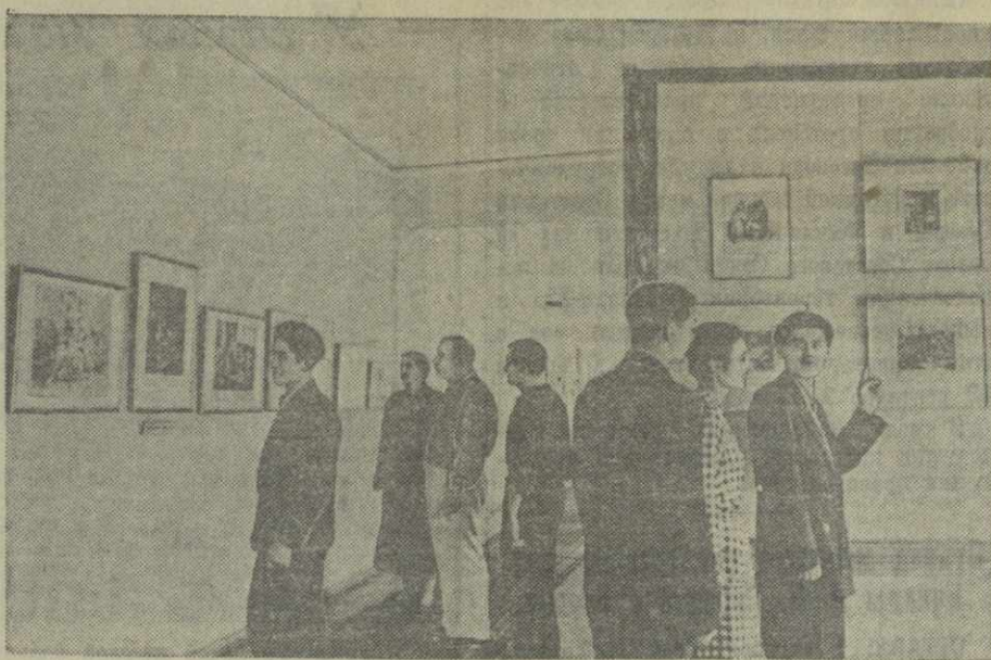
На снимке: в одном из залов выставки.