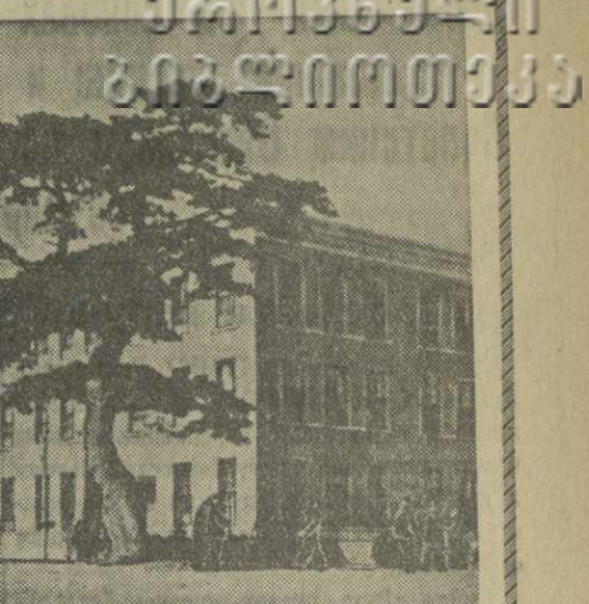
Китайская Народная Республика, Пекин, Здание Народного университета в западном предместье.