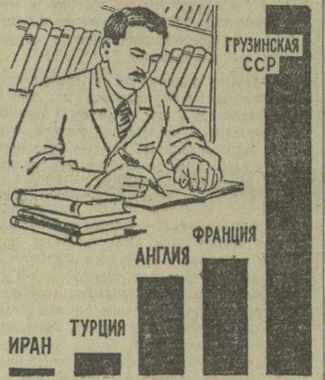
Относительное количество людей с высшим образованием на каждую тысячу человек населения.

В настоящее время идет работа по созданию новых лабораторий, оснащенных современной техникой. Это лаборатории: ма-