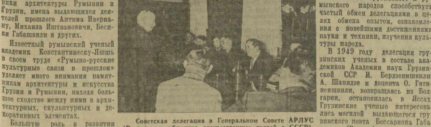
Советская делегация в Генеральном Совете АРЛДС (Румынского общества дружественных связей с СССР). Выступает председатель АРЛДС академик К. И. Паррон.