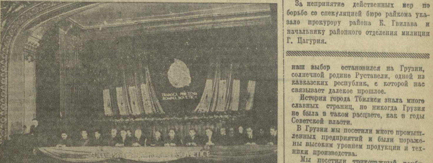
Торжественное открытие месячника румыно-советской дружбы в Атеуеме РНР в Бухаресте. Выступает министр культуры РНР Константина Кречун.