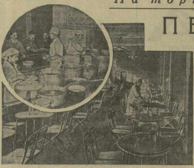
Тбилисская обувная фабрика № 1. На снимках: общий вид столовой, у раздаточного прилавка (в круге).

В конце июля или в начале августа делаем чеканку побегов. До этого, если побеги слишком развились, подвязываем их горизонтально на последней проволоке.