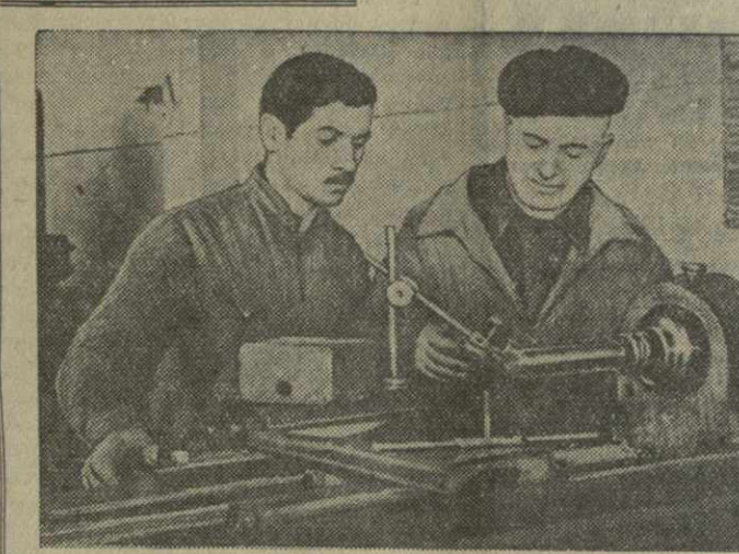
На предприятиях Грузии продолжается социалистическое соревнование за досрочное завершение первого года шестой пятилетки. В первых рядах соревнующихся идут грузинские металлурги и металлисты. Сегодня они с честью несут трудовую вахту, направляя свои усилия на то, чтобы с каждым днем увеличивать производительность труда, совершенствовать технологию производства, выпускать сверхплановую продукцию на миллионы рублей.