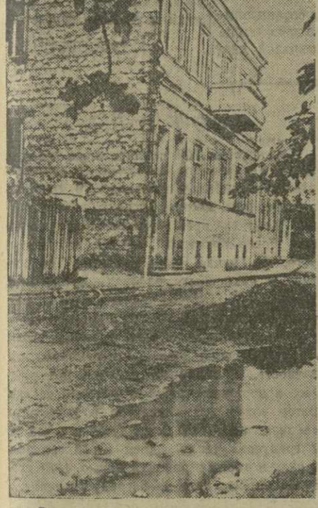
Так выглядит в дождливую погоду один из участков улицы Цхакая. В прошлом году эту улицу замощили, но плохо, и поэтому по краям улицы образуются большие лужи.

За последние годы Кутаиси обогатилась новыми кварталами жилых домов, новыми улицами и дорогами. Естественно, что возросла и ответственность исполкома городского Совета за отличное содержание городского хозяйства, за улучшение коммунального обслуживания населения второго индустриального центра республики. Надо, однако, признать, что в этой области имеется еще много недостатков. Взять, например, вопрос об уборке улиц. Несмотря на то, что за последние время очистка городских улиц производится лучше, положение все же остается неудовлетворительным. Ряд улиц (Урицкого, Кирова, Цхакая и другие) находится в антисанитарном состоянии. Этому в значительной степени способствуют инвизуальные застройки, которые прямо на улицах складывают строительные материалы и сюда же выбрасывают строительный мусор. Непонятно, почему исполком городского Совета мирится с этим. Некоторые улицы города все еще не замощены. Так, например, Вакеубашская улица. В ненастную погоду она буквально становится непроходимой.