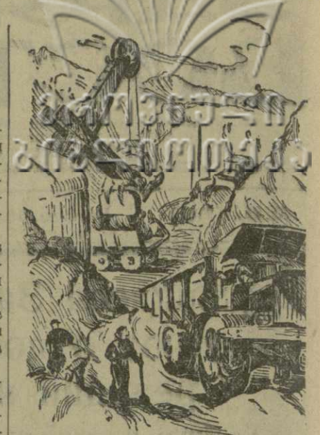
Один из участков строительства Храгас-2. Рисунок Е. Тулашвили.

В республике немало таких председателей артелей, которые работают в тесном