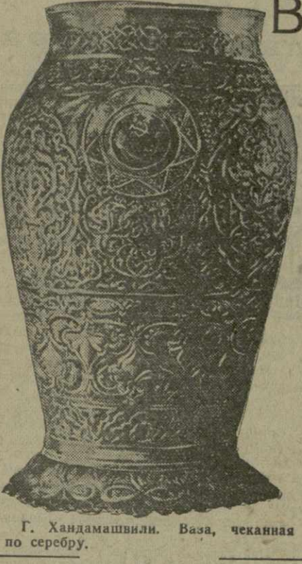
Г. Хандамашвили. Ваза, чеканная по серебру.