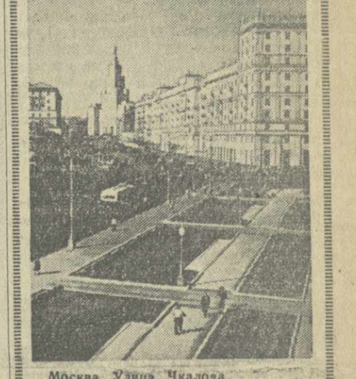
Москва. Улица Чкалова.

В заключение состоялось большое концерт советской и китайской музыки.