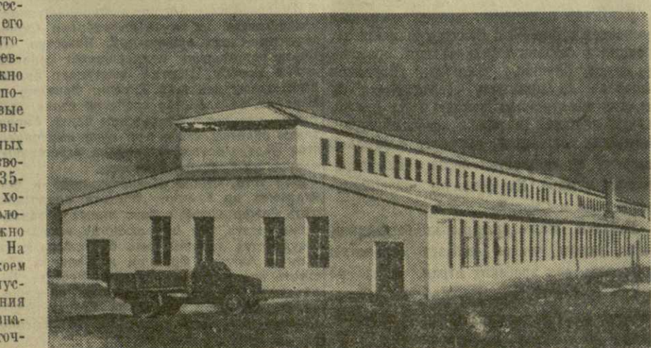
Общий вид первого корпуса птицефабрики колхоза имени Ленина.

М. НЕКРАСОВА, зав. птицефабрикой, зоотехник.