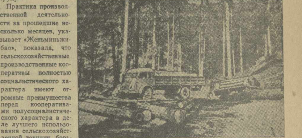
Народная Республика Албания. На лесозаготовках в северном районе страны.

До установления народной власти в Болгарии приходилось на душу населения всего 44 квч электроэнергии в год. За годы народной власти, как сообщает журнал «Новая Болгария», мощность электростанций в стране увеличилась почти в 5 раз. Ныне в Болгарии на одного жителя приходится около 280 квч электроэнергии в год. Огромные успехи достигнуты в электрификации болгарской деревни. Электричество, радио, кино становятся неотъемлемой частью быта болгарского крестьянина.