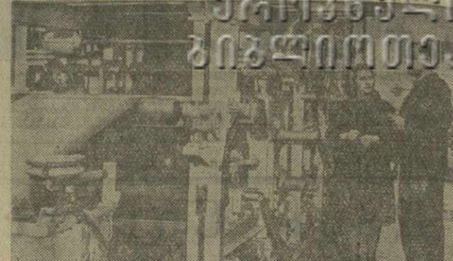
На московском заводе «Изолют» вступил в строй новый цех по производству электроизоляционной слюдяной бумаги.