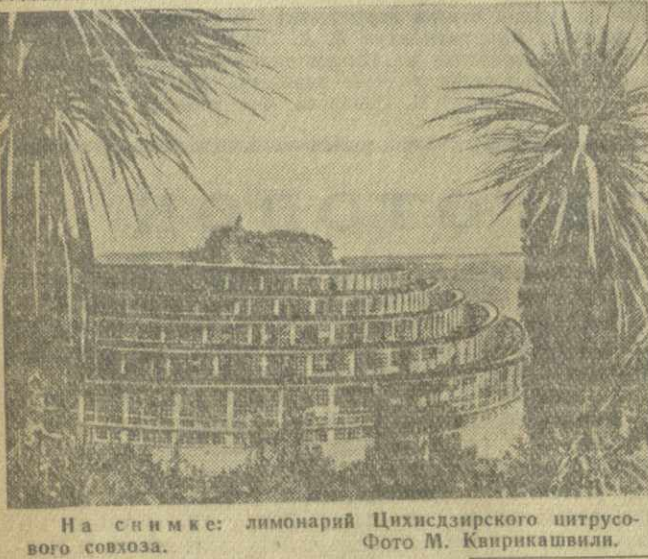
На снимке: лимонарий Цихидзирского цитрусового совхоза.

В. ЛАЛИШВИЛИ, редактор газеты «Кутанская правда».