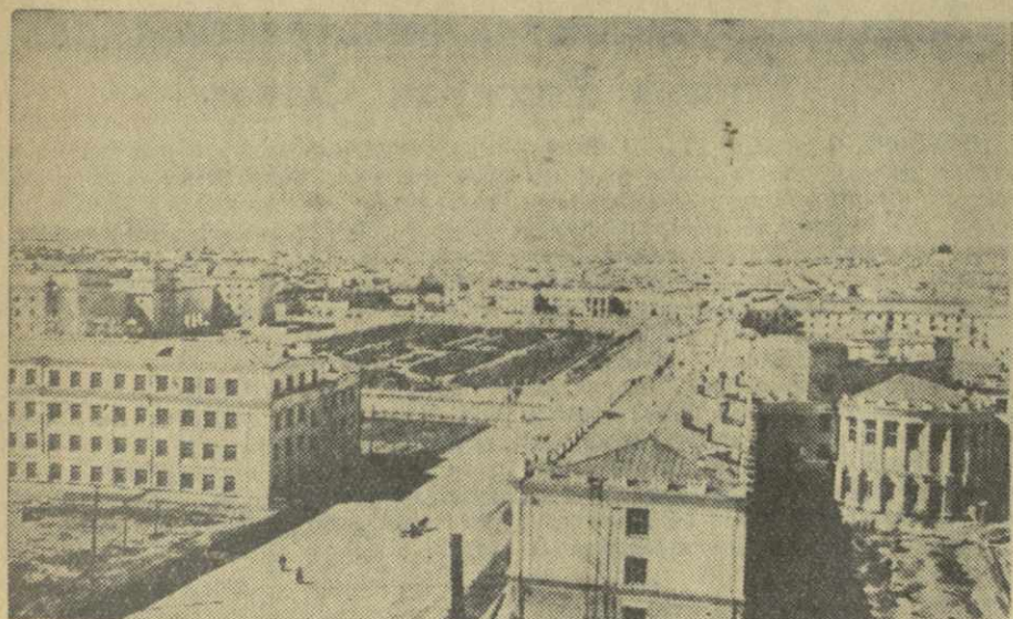
Столица Монгольской Народной Республики Улан-Батор.