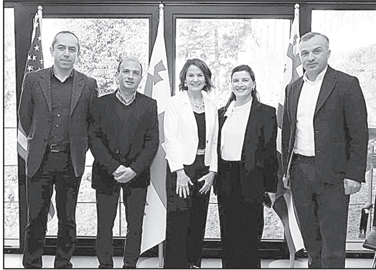
დინარე გამოჩენილ ნიშნად აქცია, – აცხადებენ სამინისტროში. მისი ცნობით, აშშ-ს ელჩმა როზინა ლ. დანიბანმა თავად მოინახულა პეტრას არქეოლოგიურ-არქიტექტურული კომპლექსი, მოის-

აჭარის კულტურული მემკვიდრეობის სააგენტომ „პეტრას ციხეზე აღმოჩენილი მოზაიკისა და მიმდებარე უბნების კონსერვაციისთვის“ მოიპოვა აშშ-ის საელჩოს გრანტი 135000$-ის ოდენობით. პროექტის მიზანია, ხელი შეუწყოს აჭარის რეგიონში, პეტრას ციხეში, აღმოჩენილი მოზაიკისა და მიმდებარე ტერიტორიის კონსერვაციას. იმ მახასიათებლებსა და ღირებულებების დაცვა შენარჩუნების, რომლებმაც პეტრას ციხე ისტორიული კონტექსტიდან გამომდინარე გამოჩენილ ნიშნად აქცია, – აცხადებენ სამინისტროში.