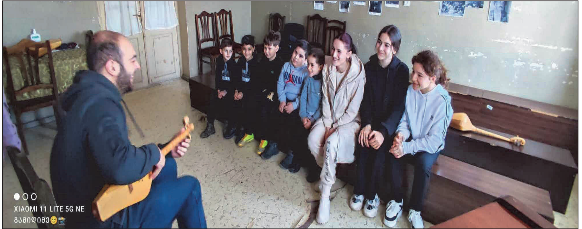
●○○ XIAOMI 11 LITE 5G NE გამიდიმა

-გეგმაში მაქვს ბავშვების ჩამოყალიბება პროფესიონალ მომღერლებად და შემსრულებლებად, ასევე, თუ მოგვეცემა საშუალება, კონკურსებში წარმოვაჩინოთ თავი, აუცილებლად წარმოვაჩინოთ, თანაც მაღალ დონეზე. - როგორც ახლადფუნქციონირებელი ხალხური სიმღერის სამყაროში და პე-