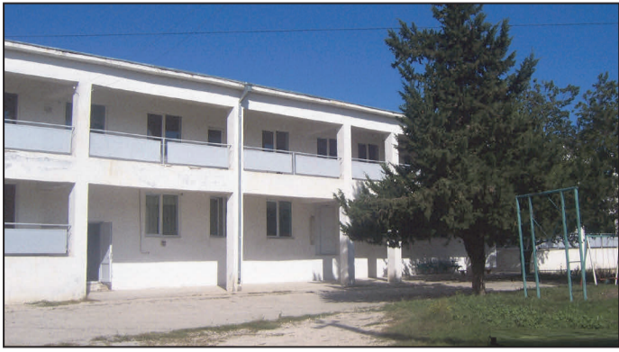
თულის ათვისებაც, მაგრამ ამ დრომდე ვერ მოხერხდა.

როგორც გაზეთ „შირაქს“ სოფელ ზემო ქედში უყვებიან, 2013 წელს ზემო ქედის №1 ბაღის რეაბილიტაცია მოხდა, თუმცა, შენობის მეორე სართული კვლავაც ძველი და უფუნქციოა. კულტურის სახლის გვერდით მდებარე ე.წ. „კანტორის“ შენობაში საბავშვო ბაღი რამდენიმე ათეული წლის წინ შეასახლეს, მანამდე ნაქირავებ ფართში ფუნქციონირებდა. „ქართული ოცნების“ ხელისუფლებაში მოსვლის შემდეგ კი, პირველი სართული თანამედროვე სტანდარტებით მოეწყო. ამ ხნის მანძილზე იგეგმებოდა მეორე სარ-