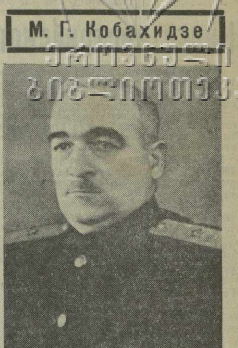
М. Г. Кобахидзе