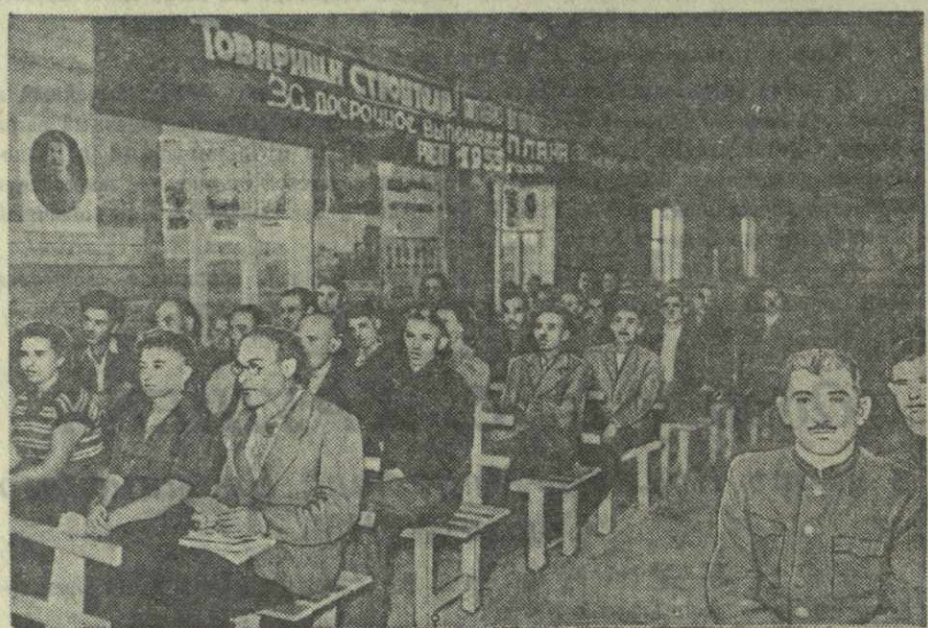
На отчетно-выборном собрании парторганизации Руставского азотно-тукового завода.

(Из Призывов ЦК КПСС к 38-й годовщине Великой Октябрьской социалистической революции).