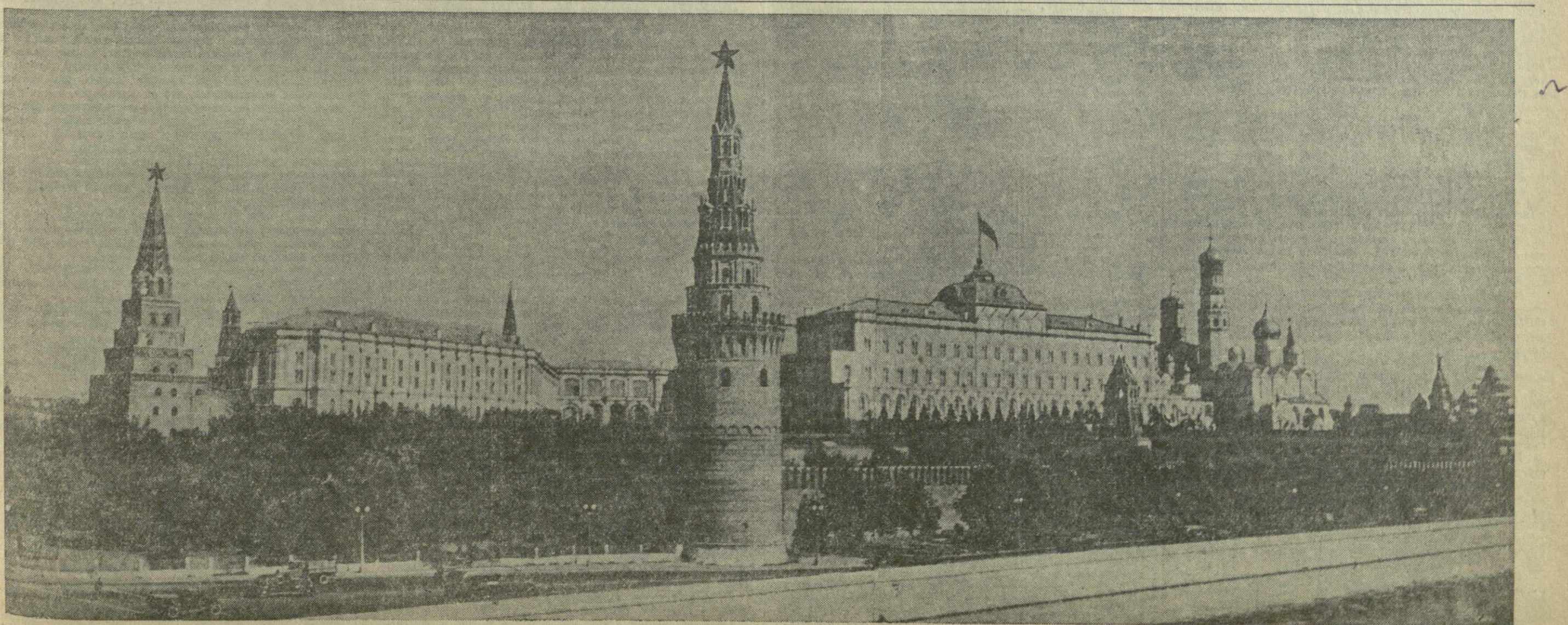
Столица нашей Родины — Москва.