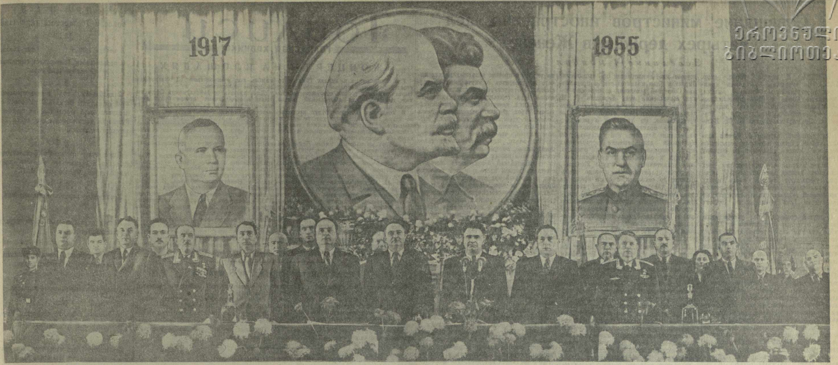
Тбилисский государственный театр оперы и балета им. З. Палиашвили, 6 ноября 1955 г. На снимке: президиум торжественного заседания, посвященного 38-й годовщине Великой Октябрьской социалистической революции.