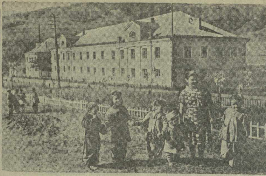
Поселок Кванса (Юго-Осетия, Джавский район). Кванское рудоуправление выстроило и сдало в эксплуатацию в текущем году 22-квартирный жилой дом для горняков. Такой же второй дом будет заселен к концу года. На снимке: дети горняков у нового 22-квартирного жилого дома.

Участники сессии приняли решение, направленное на дальнейшее укрепление общественного порядка в Тбилиси.