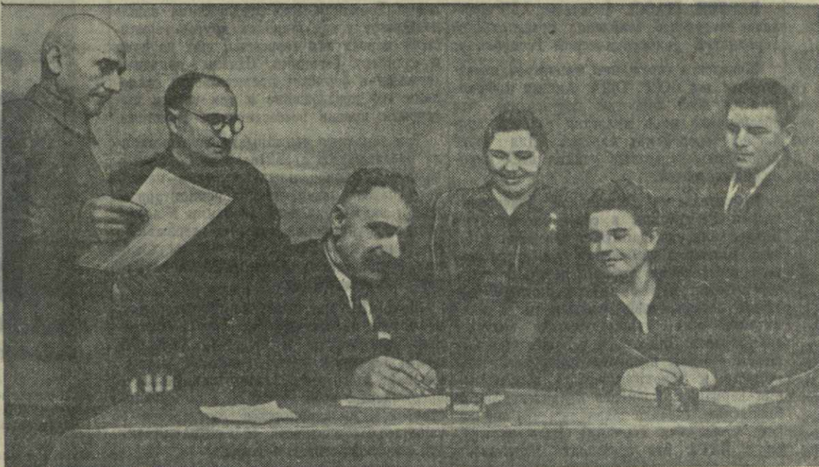
Подписание договора о социалистическом соревновании на 1956 год между колхозами имени Молотова села Тимонино Раменского района Московской области и имени Махарадзе Гареубанского района Грузинской ССР.

Пребывание русских колхозников в Грузии вылилось в яркую демонстрацию братской дружбы народов нашей страны.