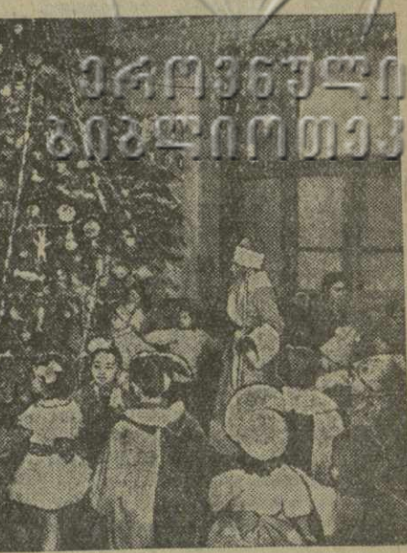
На снимке: на новогодней елке в 43-й тбилисской средней школе.

дворовые елки были зажжены и в некоторых других домах. «43-я тбилисская средняя школа. В просторном зале стояла большая народная елка, любовно украшенная руками детей.