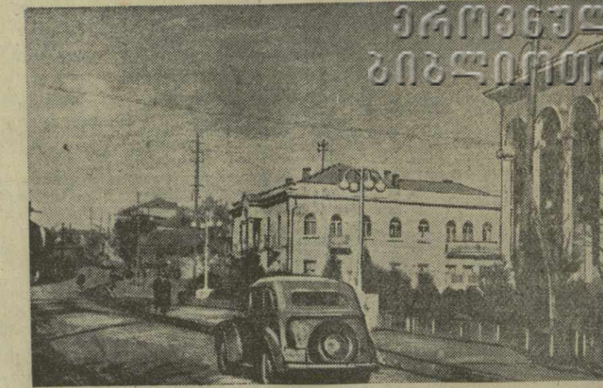
Вместе с другими районными центрами Грузии растет и расширяется поселок Каспи. Жилые и культурно-бытовые новостройки изменяют облик улиц поселка, свидетельствуют о неустанной заботе партии и правительства об удовлетворении материальных потребностей трудящихся. Большое внимание уделяется благоустройству улиц Каспи. Центральная магистраль поселка покрыта асфальтом, озеленена, украшена лампами. На снимке: центральная улица Каспи.