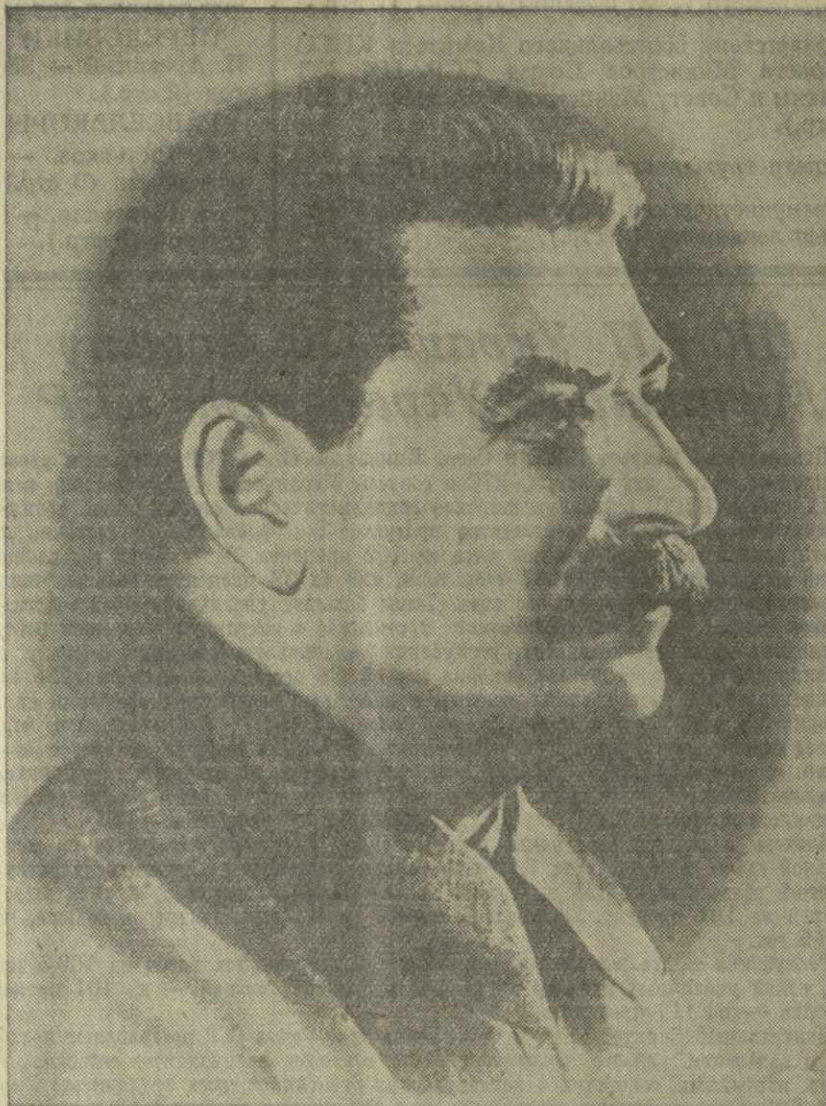
И. В. Сталин.

XX съезд КПСС осудил культ личности и развенчал его антимарксистскую сущ-