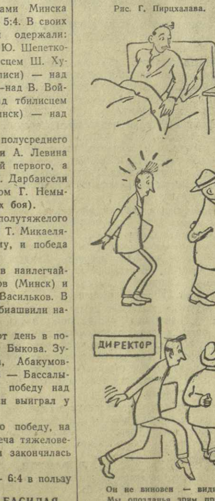
Он не виноват — видит бог, Мы опоздали эрич причину, Нитка он обойти не смог Сило начальственную спину.