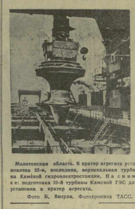
Молотовская область. В кратер агрегата установлена 23-я, последняя, вертикальная турбина Камской гидроэлектростанции.