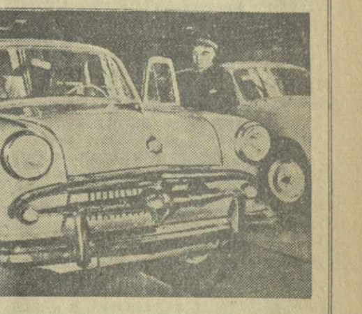
В следующем году коллектив Московского завода малолитражных автомобилей приступил к массовому выпуску нового автомобиля «Москвич» модели «402».

Петрозаводский домостроительный комбинат, сообщая, сообщает газета «Ленинская правда» (Карельская АССР), изготовляет стандартные дома с центральным отоплением для новоселов Казахстана.