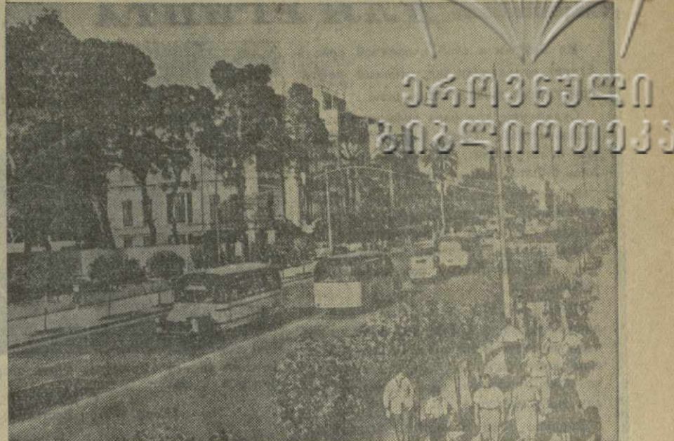
В этом году большая группа советских туристов совершила путешествие вокруг Европы на теплоходе «Победа». Туристы прошли по нескольким морям и Атлантическому океану, посетили Болгарию, Грецию, Италию, Францию, Голландию и Швецию. Они побывали во многих интересных городах, осмотрели памятники старины и сокровищницы культуры, познакомились с жизнью и бытом различных народов.

Л. ВАЙНЕР, заместитель главного инженера треста «Закметаллургстрой».