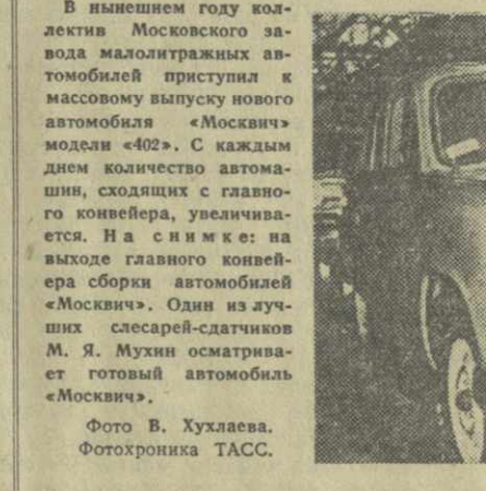
В нынешнем году коллектив Московского завода малолитражных автомобилей приступил к массовому выпуску нового автомобиля «Москвич» модели «402».

Днепропетровский завод металлургического оборудования имени Молотова изготовляет оборудование для сооружаемого в Индии с помощью Советского Союза металлургического завода.