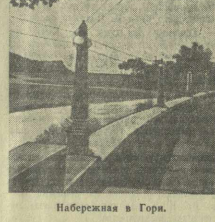
Набережная в Гори.