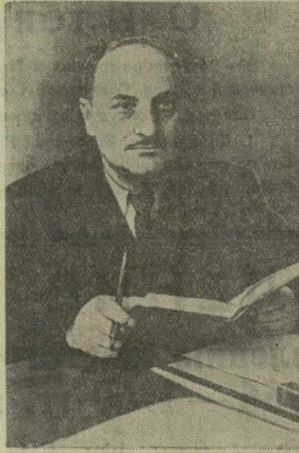
Демна Шенгелая за работой.

Писательская общность Грузии отмечает 60-летие со дня рождения одного из лучших мастеров грузинской советской прозы — Демны Шенгелая.