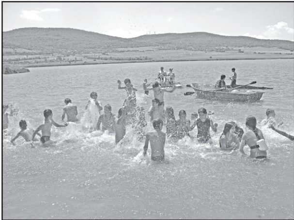
ივლისის სვამბა საფიქრალი გაუჩინა დედაქალაქში დარჩენილებს – სულის მოსათქმელად ზოგმა თბილისის ზღვას მიაშურა, ზოგმაც კუს