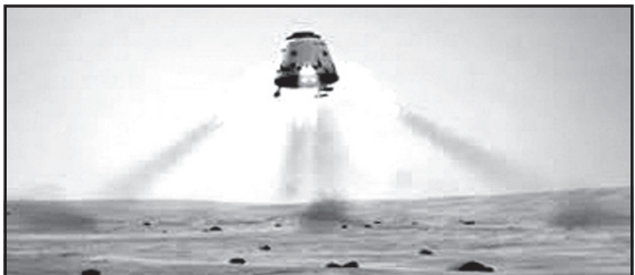
ვალეობა ადამიანთა უცხოპლანეტური ბაზების დაცვა იყო... მტრულად განწყობილი ადგილობრივი მოსახლეობისგან!