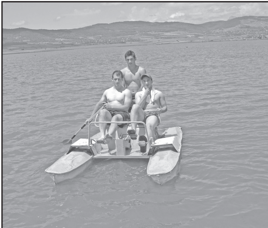
და ლისის ტბებს, მცხეთელმა და დუშელმა ახალ-გაზრდებმა კი ბაზალეთის ტბა არჩიეს.