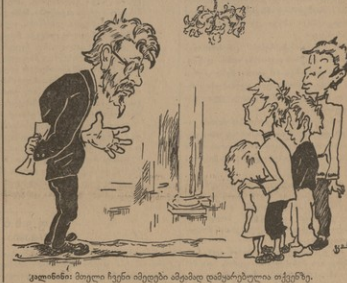
კალინი: მიუღო ჩვენი იმელები ამფადა დამყარებულია თქვენი.

8 ოქტომბერს სამი ექვსის ეღიფილი სამხის პრეზიდენტი ანგლიკონ უჩანასწორი, ტურქეთის მთელი კონტინენტი ეველები და მისთა მათ გრული სიტყვა.