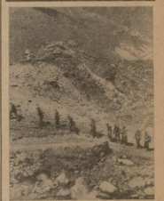
სულკოვანი ხმონახით მშვიდმალისამდე

19 ნოემბრის ქალაქ რომში გამოცხადბა ნაციონალური დამბზობი მოქმეობის გერმანიელ ტერბრბა - გახზეობის დღი გამოცხადბა. ამ გამოცხადბ ტულ ვაკეცენის გერმანიული პარტის, როგორც მშობლიური ებბრბობი ავტრეველი ფაქტობის გავლენა გერმანიული ერთეული ცხოვეობის ყველა დარბევა.