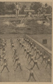
არტის სახალხო დღე. მილიონობით გერმანიული ახალგაზრდები სიხად თვითინი მათეს, მონაწილეობენ შეჯიკრებებში, რომელიც მთლიანად სპორტბის ახალგაზრდობა.

სპორტბი თანამედროვე გერმანიის სოციალური მოღვაწეობისა და ნაციონალური პოლიტიკის უნივერსალურადგანსილ დარეკა შეეპოიბინის ერთობის აღზრდა, სტალინი პარტიული განკარგულება შეხატება ახალი, სიამაყე-ით რას ენახსურება გერმანიული სპორტბი, თვითრული ქალაქში სოფელში, ფაბრიკაქარბანაში, გავილილი მასობრივი სპორტბილი მუხარბა, მოსახლეობა აქტივი მონაწილეობას იღებულობს ამ დღის სახელმწიფოებრივი მნიშვნელობის საწეში. გარდა ამისა გერმანიის რესპუბლიკა 4 მხებილი სესპორტბი სახეობებია: — ფიზიკური აღზრდის ნაციონალ-სოციალისტური ობობაზისა, რომელიც აფიონარბებს განმარტობა სპორტბული ვადებულებას, კავშირებს, — სპორტბის ახალ-ზარდი თანება: ავადები და გოგონები, აგრძობის შირბის ფორმირა, რომელიც ენახსურება მუშათა ფიზიკურ აღზრდას ფაბრიკაქარბანაში და ბოლოს სამხედრო სპორტბული კავშირები. სპორტბი განმარტობა ხალხის საყვარელი საწეში. მონაწილეობა უდიდესი ურთიფილით აფეთქების თვალს სპორტბული მოღვაწეობის მხრად ტრადება ე. წ. სპორტბის სახალხო დღე. მილიონობით გერმანიული ახალგაზრდები სიხად თვითინი მათეს, მონაწილეობენ შეჯიკრებებში, რომელიც მთლიანად სპორტბის ახალგაზრდობა. ნაციონალ-სოციალისტური გეგმითანება ახალ სპორტბის სახალხო დღე.