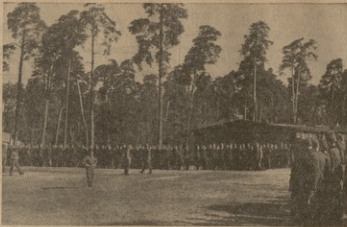
პარკიული ლაბორირი. სამწოზარო მიკავლინობა

▲ ავსტრი "არადა" აღნიშნება, რომ ამგვარად საპროტა კავშირის ხელში არსებული მადარობები ქვანახარის ამონაღება ერთხელ დეკა. ამის გამო რაიდადებში პარკიდება მსოფლიოდა მასუბინებაში.