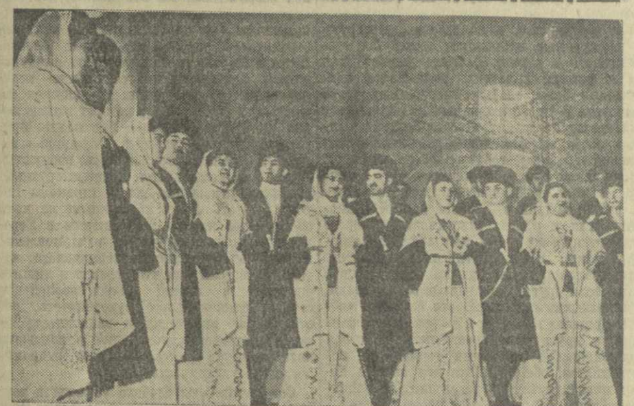
Государственный ансамбль песни и танца Юго-Осетии исполняет сценку.