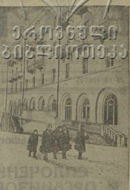
Закончено строительство дома-интерната на шахте имени Ленина в Тибуду. Она предназначена для 150 молодых рабочих, окончивших горнопромышленную школу. На снимке: новое здание дома-интерната.