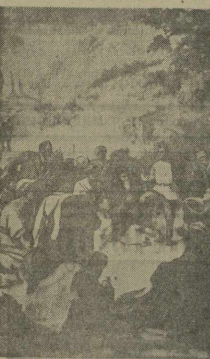
Киров среди горцев. С картины художника М. Кокоева.

На сцене: сцена из пьесы Д. Туаева «Мать сирота».