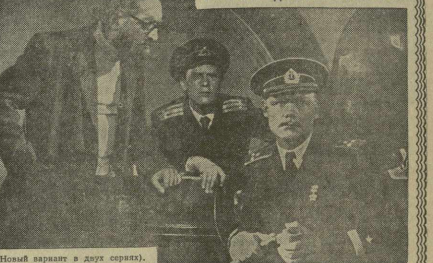
(Новый вариант в двух сериях).

Производство Ордена Ленина киностудии «Грузия-фильм».