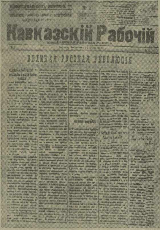
«Кавказский рабочий» становится любимой газетой трудящихся и солдат на фронте и в тылу.

11 (24) марта 1917 года в Тифлисе начала выходить на русском языке газета большевиков Закавказья — «Кавказский рабочий», в дальнейшем ставшая органом Красного и Тифлисского комитетов РСДРП(б). Газета в короткий срок получила широкое распространение по всему Закавказью и среди солдат Кавказской армии.