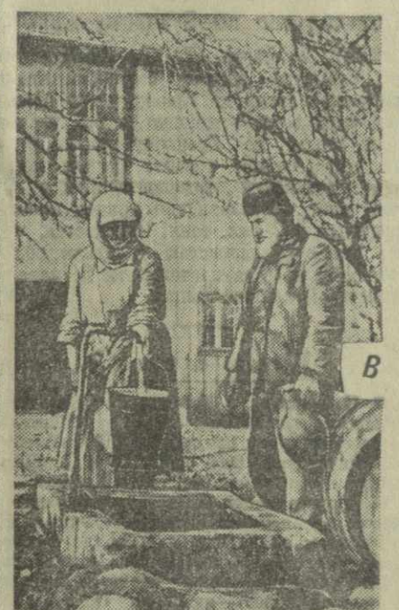
Колхоз имени Молотова села Пигтехов в течение многих лет был в числе отстающих в Маяковском районе.