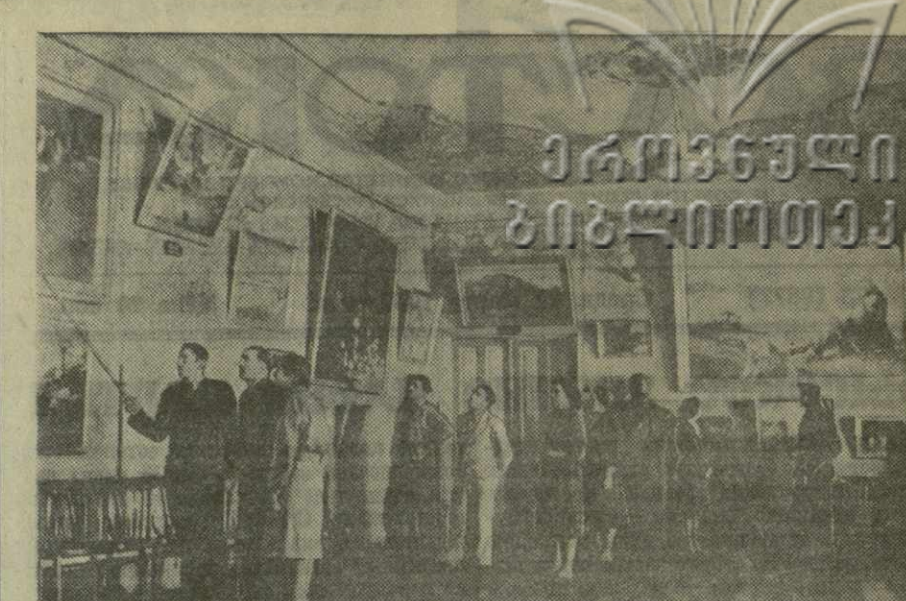
В зале Боржомского Дома культуры открыта выставка работ грузинских художников.

Полученная в Чиатура погрузочная машина в прошлом же году была испытана на одном из участков рудника имени Ленина в присутствии представителей Славянского конструкторского бюро и