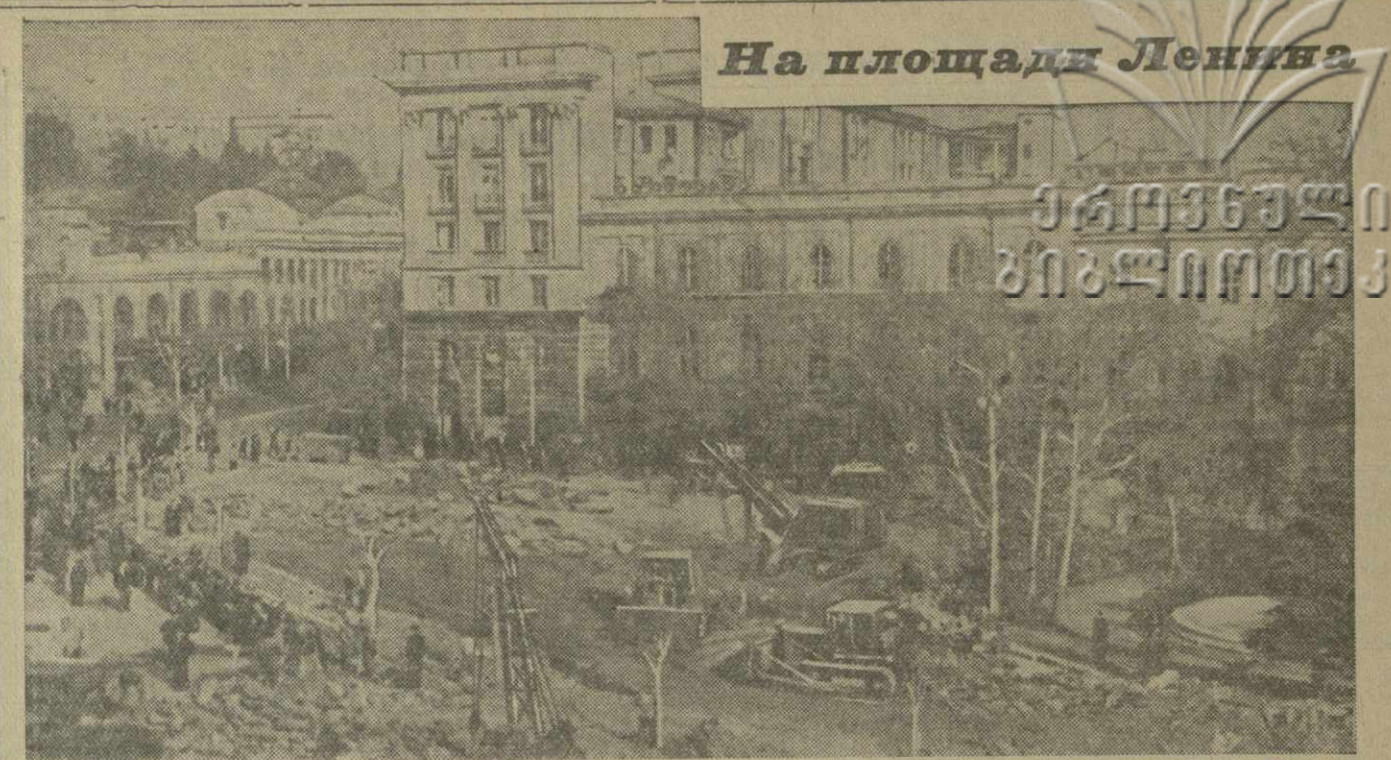
С понедельника развернулись большие работы по благоустройству и реконструкции площади имени В. И. Ленина и примыкающего к ней сквера. Площади придется более правильная форма. Значительно расширится сквер. Памятник Пушкину переместится в центр сквера. Бюст великого поэта будет обращен лицом к зданию Музея искусства Грузии. Управление благоустройства исполкома Тблгорсовета, которое ведет эти работы, закончит их к 1 мая.

КАИР, 15 апреля. (ТАСС). Положение в Иордании вызывает глубокую тревогу египетской общественности. Печать сообщает, что реакционные силы в Иордании идут на обострение политической обстановки в стране. Газеты пишут, что в Иордании проводятся аресты демократически настроенных политических деятелей, а также армейских офицеров, принадлежащих к организации „Свободные офицеры“. Агентство MEN передает, что реакционные элементы в сотрудничестве с лидерами „Муусульманского братства“ организовали в военном лагере Эз-Зарк волнения, приведшие к столкновению с войсками. Имеются убитые и раненые. БЕИРУТ, 15 апреля. (ТАСС). Касаюсь происходящих в Иордании событий, газета „Аш-Шарк“ пишет, что положение там становится все более напряженным. Вчера утром, указывает газета, по распу-