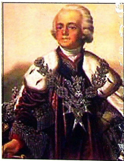
პავლე I (1796-1801)