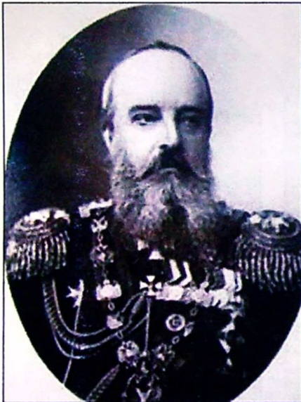
მუვისნაცვალ-მიხეილ ნიკოლოზის ძე რომანოვი (1862-1881)