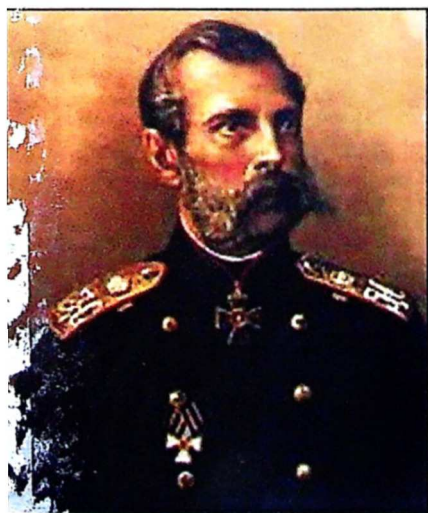
ალექსანდრე II (1801-1825)