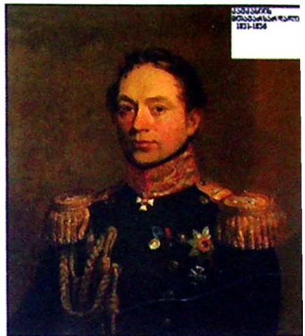
ბარონი როზენი კავკასიის მთავარსარდალი (1834-1836)