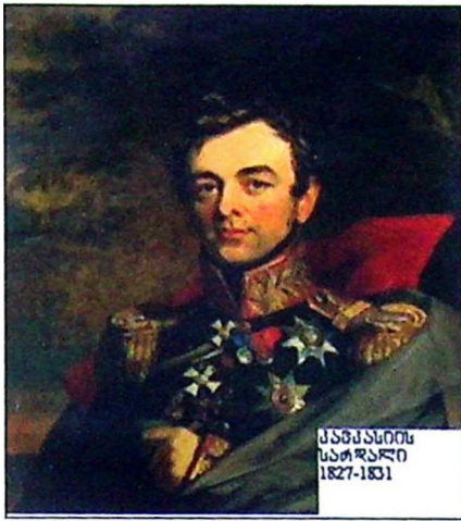
ი.გ. პასკევიჩი კავკასიის სარდალი (1827-1831)