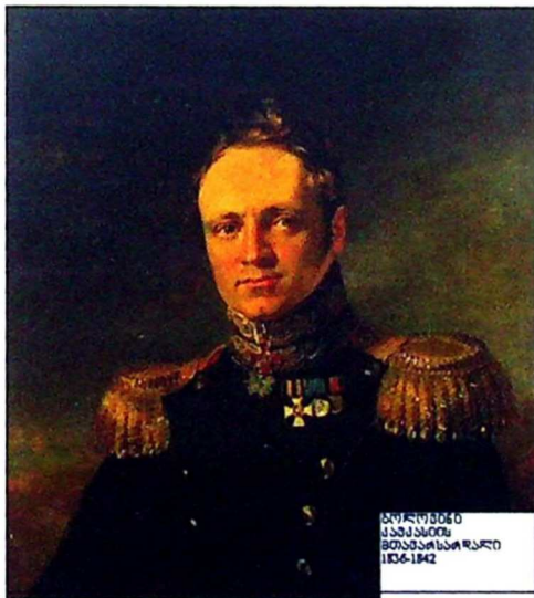
გოლოვინი კავკასიის მთავარსარდალი (1836-1841)