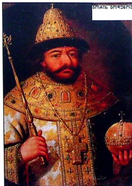
მეფე ბორის გოდუნოვი (1595-1605)