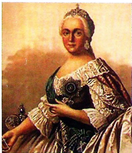
კატერინე II (1762-1796)