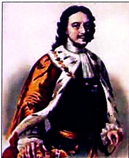
პეტრე I (1682-1725)