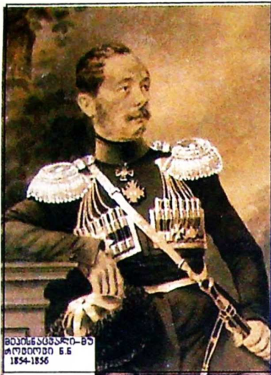
ნ.ნ. მურავიოვი (1854-1856)