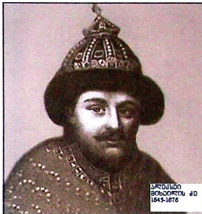
ალექსეი მიხეილის ძე (1645-1676)