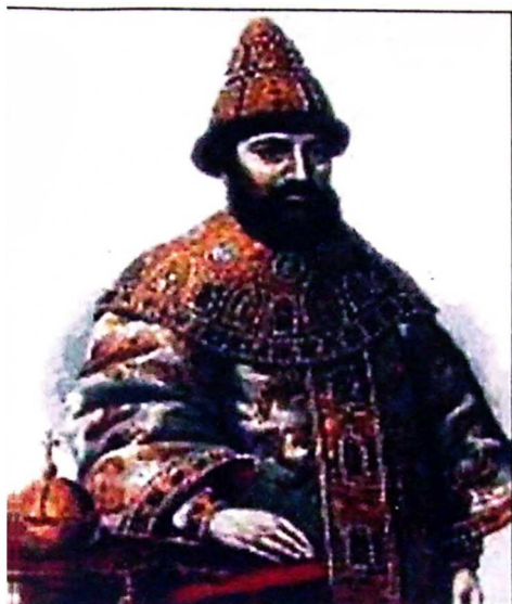
მეფე მიხეილ თევდორეს ძე რომანოვი (1613-1645)