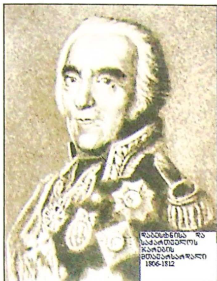
რანსტენისა და სამატიონის ჯარების მთავარსარდალი 1806-1812