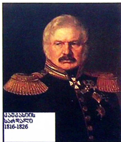
ქაშახის სარდალი 1816-1826