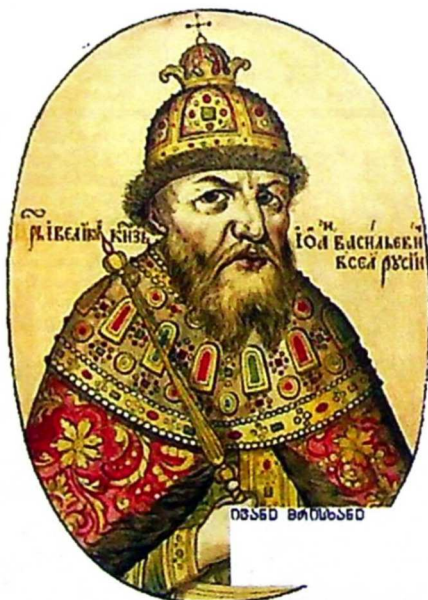
ივანე მრისხანე (1533-1584)