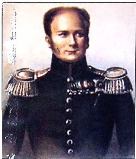
ალექსანდრე I (1855-1881)