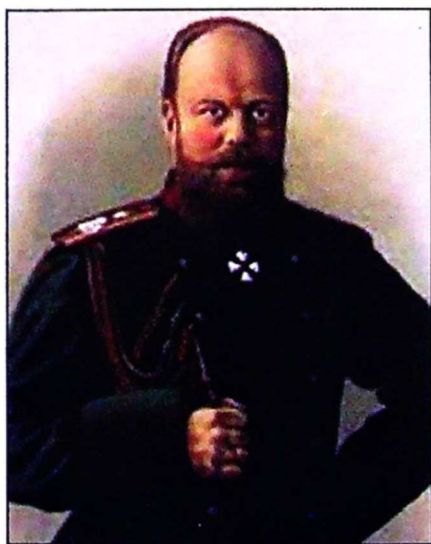
ალექსანდრე III (1881-1894)