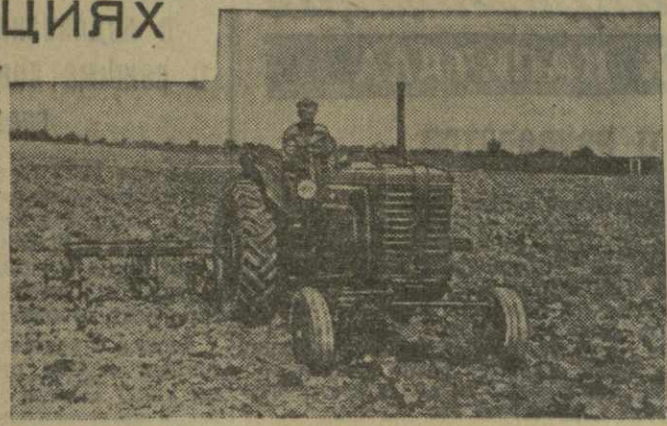
Фото Г. Киквалдзе и Ю. Бакабашина. (Фотохроника ГрузТАГа).