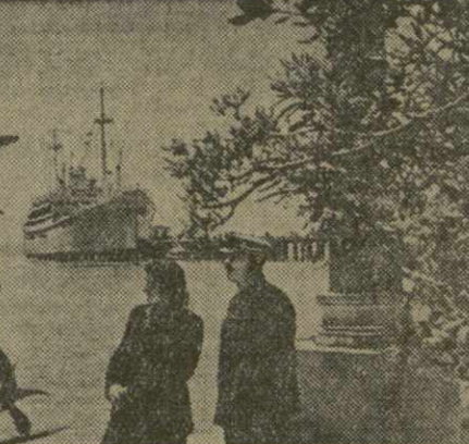
На снимке: теплоход «Победа» у причала Сухумского порта.

СУХУМИ. (Корр. «Заря Востока»). Сухумская база самая крупная в Советском Союзе. Она первой открыла в нынешнем году туристский сезон. В Сухуми уже побывали сотни туристов из различных концов нашей страны. Готовясь к открытию, работники базы капитально отремонтировали спальный корпус, кухню, столовую, оборудовали спортплощадки. Автопарк базы расширен на 10 машин. Наряду с трудящимися Советского Союза Сухумская туристская база примет в этом году туристов из Германской Демократической Республики и Чехословакии. Совершая путешествие по Советскому Союзу, они побывают на Черноморском побережье — в Сочи, Гагра, Сухуми. Завер-