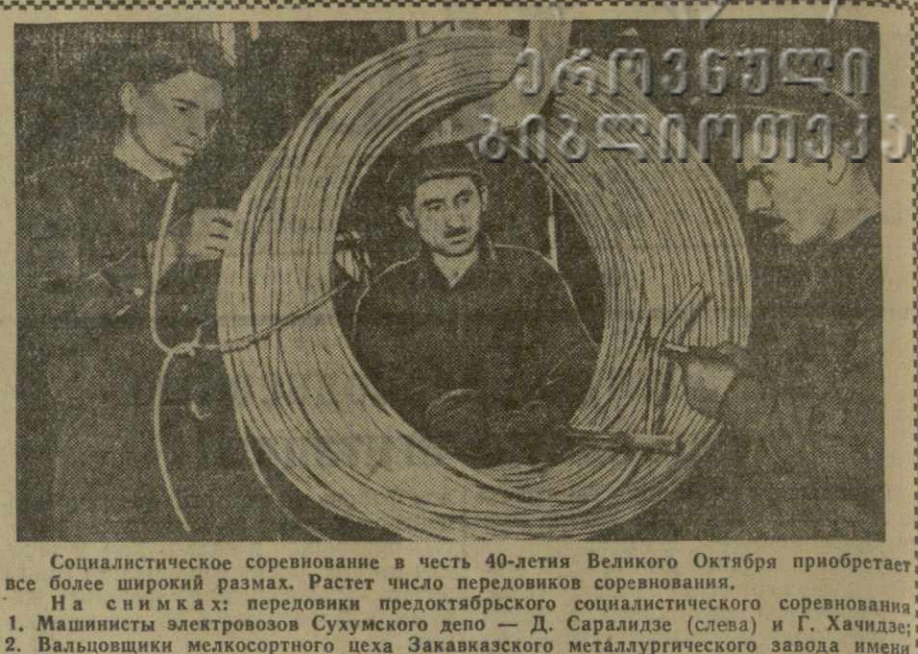
Социалистическое соревнование в честь 40-летия Великого Октября приобретает все более широкий размах. Растет число передовиков соревнования.

Солдаты и рабочими прифронтовой полосы был создан целый аппарат распространения большевистской печати. При помощи железнодорожников,