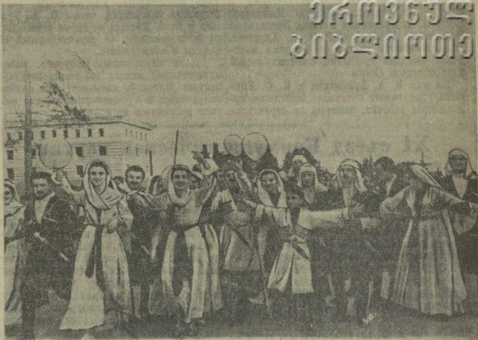
На снимке: молодежь идет с песнями и танцами по улицам Сухуми.

На проспекте Руставели, на берегу Черного моря, собралось тысячи участников первого областного фестиваля молодежи. Город, одетый в праздничный наряд, встретил гостей цветами, песнями, музыкой, лозунгами, отражающими неизблемую дружбу народов, стремление советских людей к миру во всем мире.