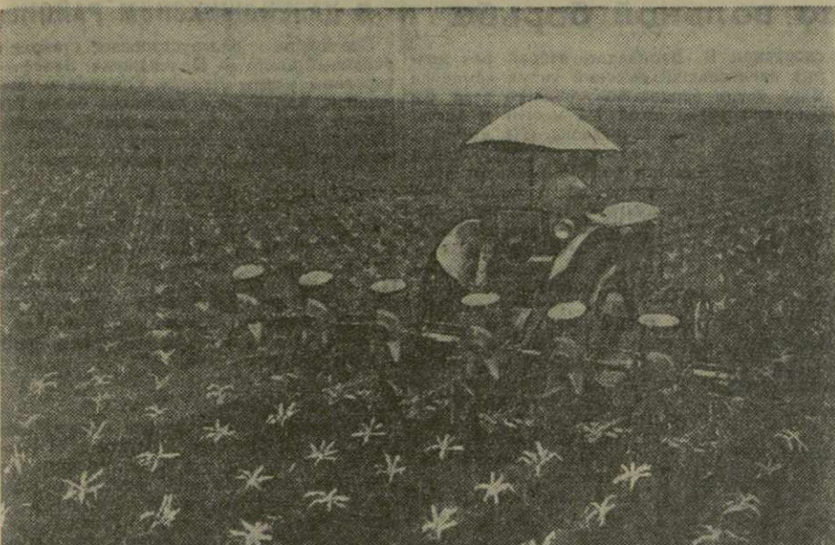
Тракторная культивация междурядий кукурузы, посеянной квадратно-гнездовым способом на полях колхоза имени Калинина села Арбошки Цителкарского района. Аход за кукурузой ведут механизаторы Гамарджеской МТС.