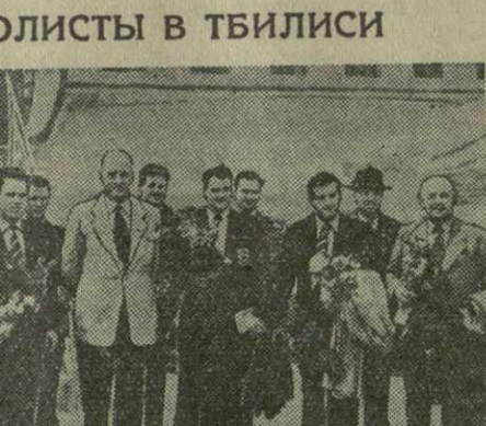
На снимке: группа английских футболистов в Тбилисском аэропорту.

Вчера утром спортивная общественность столицы нашей республики тепло встретила прибывших в тбилисский аэропорт футболистов английского клуба «Вест Бромвич Альбион».