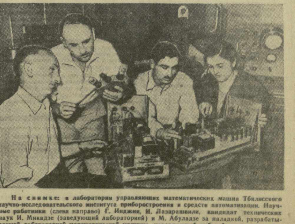
На снимке: в лаборатории управления физико-математическими машинами Тбилисского научно-исследовательского института приборостроения и средств автоматизации.

Большие и ответственные задачи будут решать ученые Грузии в шестой пятилетке.