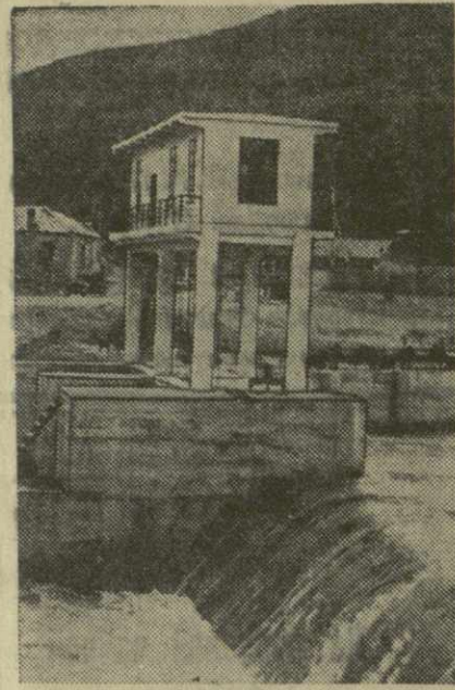
На снимке: головное сооружение Мехранской оросительной системы на реке Арагви.

А. ГЕЛАШВИЛИ, П. ШУРОВ. (Спец. корр. «Зари Востока»).