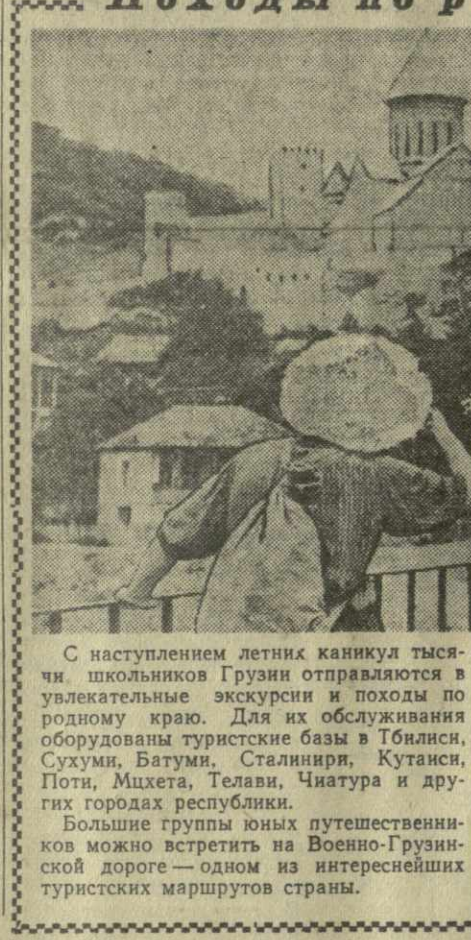
С наступлением летних каникул тысячи школьников Грузии отправляются в увлекательные экскурсии и походы по родному краю.

Для их обслуживания оборудованы туристские базы в Тбилиси, Сухуми, Батуми, Сталинири, Кутаиси, Поти, Микхета, Телави, Чиатура и других городах республики. Большие группы юных путешественников можно встретить на Военно-Грузинской дороге — одном из интереснейших туристских маршрутов страны. Дети знакомятся с живописными местами, памятниками материальной культуры, собирают экспонаты для коллекций, пополняют знания, полученные в школе. На снимке: юные туристы осматривают один из замечательных памятников древней грузинской архитектуры — крепость в Анаури.