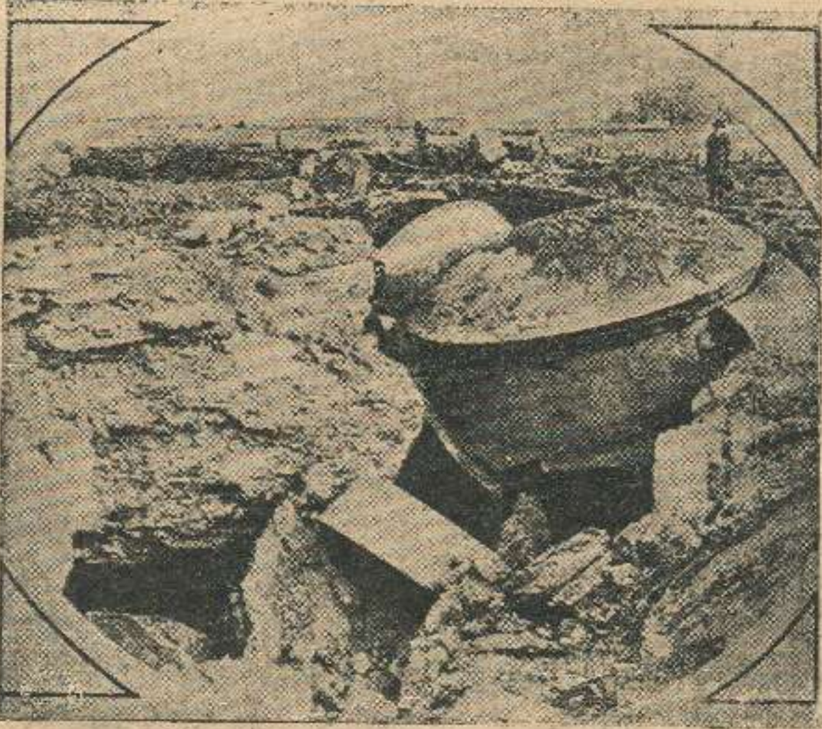
ბეტონის ერთ-ერთი სიმაგრე ლიეჟში, რომელიც გერმანიის მძიმე არტილერიამ დაანგრია