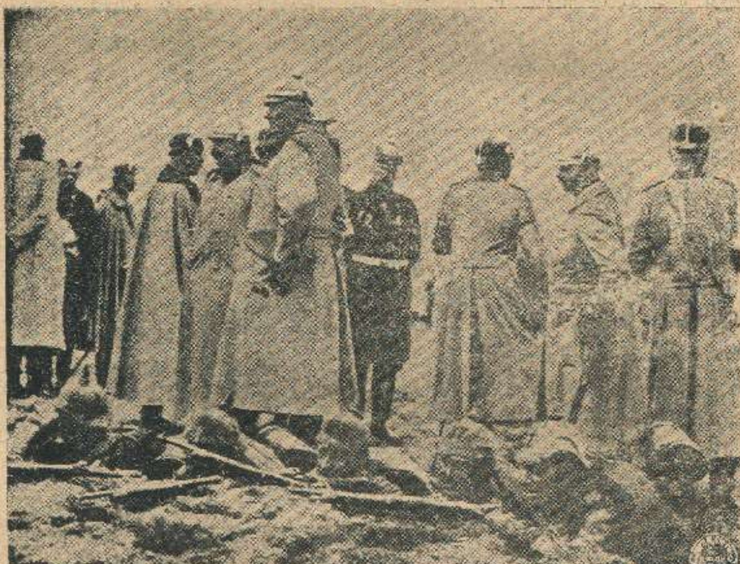
გერმანელთა ჯარი. იმპერატორი ვილჰელმი და მთავარ შტაბის უფროსი ფონ მოლტკე საპოზიციო თხრილებთან.