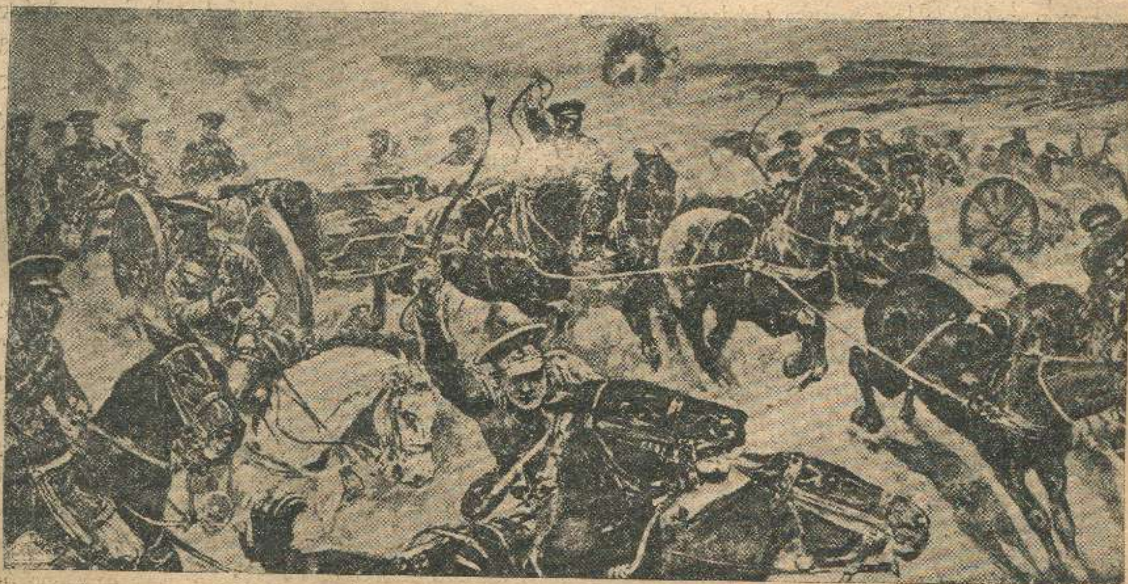
ინგლისური არტილერია მიისწრაფვის პოზიციებზედ.