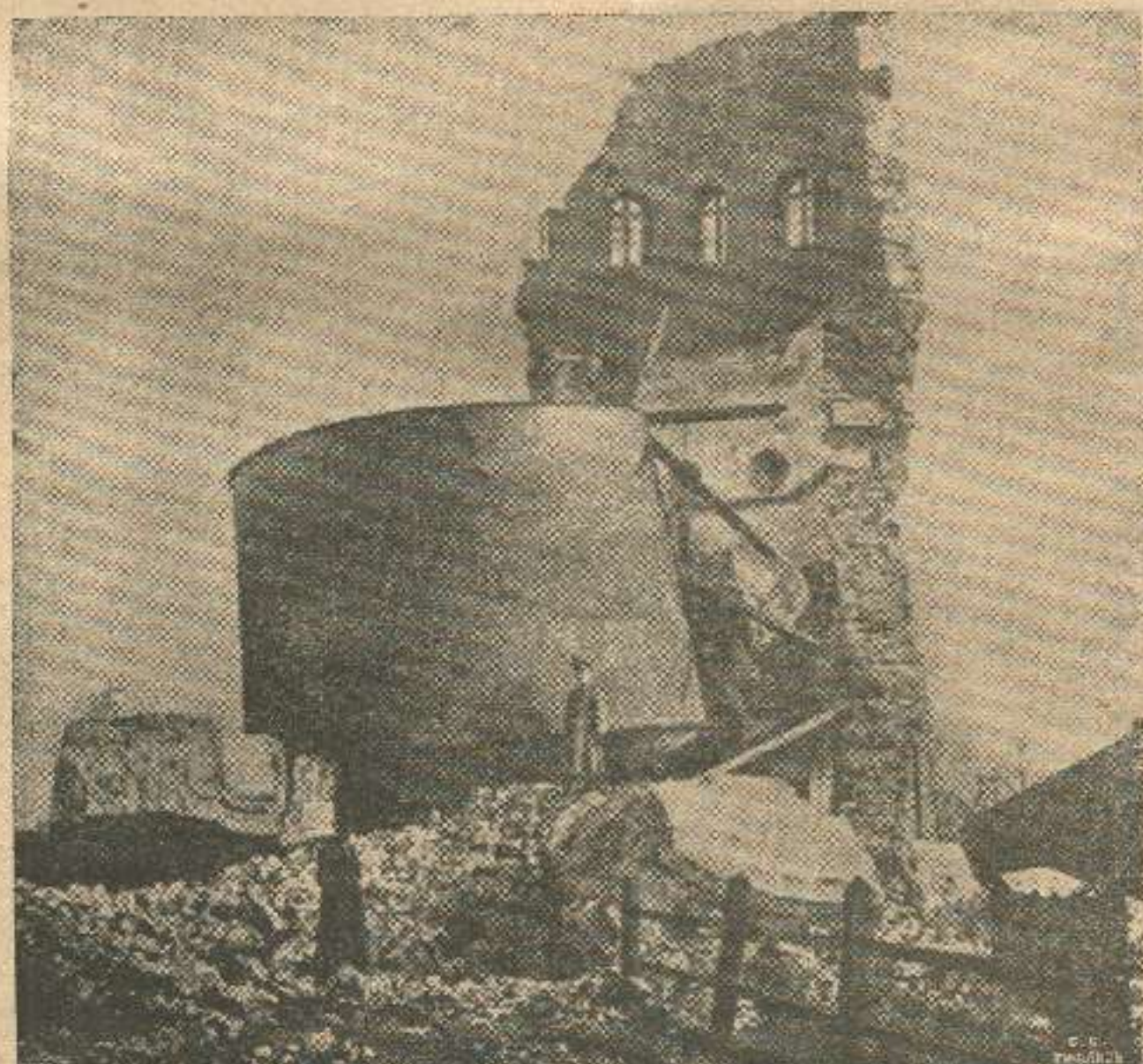
გერმანელებისაგან აფეთქებული წყლის კოშკი ქ. ლომში.

აი, როდესაც საკითხი სდგებოდა იმისა თუ რა დახმარება აღმოეჩინოს სოფლებს—შესწავლეს და ჯარში გაწვეულთა ოჯახებს—უმთავრესი ყურადღება უნდა მიექცეს არა საქველ-მოქმედოთ ფულის დარიგებას,—რითაც ხალხი მხოლოდ ირყვნება და მეურნეობასაც არაფრით არგებს,—არამედ შრომის ორგანიზაციას . ეს ორგანიზაცია ბევრის მხრით გააუმჯობესებდა ეხლანდელს მდგომარეობას და მომავლისათვისაც მოამზადებდა უკეთეს ნიადაგს განვითარებისათვის. ყველა ის თანხები, რომელიც შეიძლება გადადებული იყოს თავად-აზნაურობისაგან, ერობის კავშირისა თუმთავრობ., უნდა მოხმარდეს საზოგადო სამუშაოთა შექმნას. უნდა შეიქმნას კოოპერატივები ნაწარმოებთა გასასაღებლად, საცა ეს ნაწარმოები რჩება გაუყიდავი, მაგალითად ხილი ქართლისა, თამბაქო შავი ზღვის ნაპირებისა და ქიზიყისა, რომელიც იმისდა მიუხედავად რომ თამბაქო არამც თუ აკრძალული არ არის, არამედ დიდ