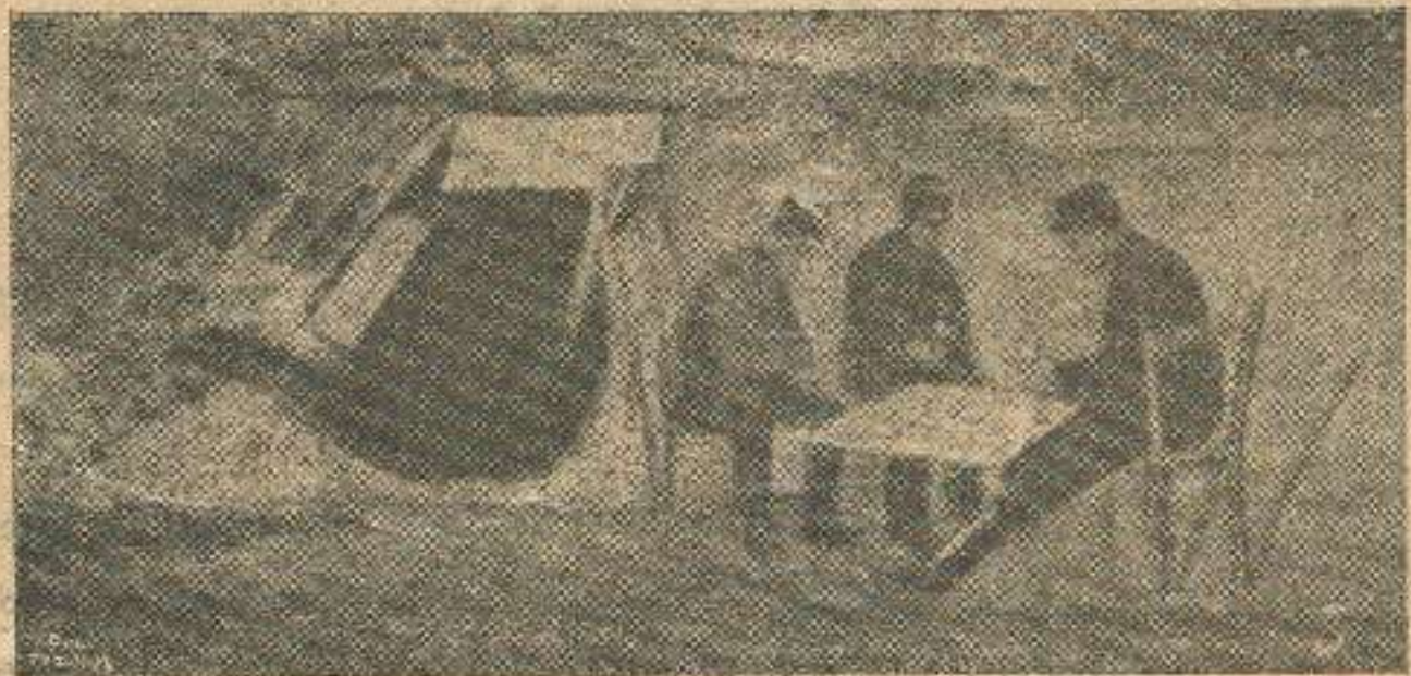
ფრანგების ჯარი ბრძოლის ველზედ ერთობა.

დაუჯერებელი ამბავი ის იყო, რომ აქამდისაც საქართველოს ეკლესიის ავტოკეფალიის იდეა თითქმის რევოლიუციონურ იდეად ითვლება და ამისათვის ხალხიც ისჯებოდა, თორემ გასაკვირველი კი არა სავალალოა, რომ ის იდეა ეკლესიის თავისუფლებისა, რომელიც ასულდგმულებს ყოველ მორწმუნე ქართველს, მარტოდენ შეეძლება გააღვიოს ის ეროვნულ-სარწმუნოებრივი ძალი, რომელსაც მსხვერპლად ეწირებოდნენ საუკეთესო შვილნი ჩვენის ისტორიისა რაც შეეხება კირიონის რეპილიტაციას, ჩვენ არ ვიცით, რამდენადაა იგი ნამდვილი, თუ სადმე რუსეთში გაამწესებენ.