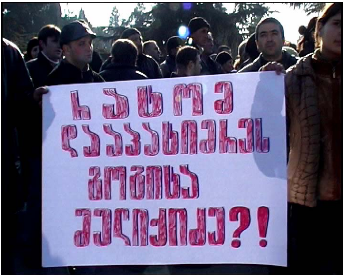
სახალხო მიტინგი უსამართლო პატიმრის გათავისუფლების მოთხოვნით

«გუბერსკის» დესპოტური ციხისა და რუსთავის საპყრობილის საშინელ პირობებში გავატარე სასჯელის ძირითადი ვადა და ახლა, როდესაც თავისუფლებამდე თითზე ჩამოსათვლელი დღეები დამრჩა, გინდათ მოიღოთ მოწყალეობა და ამ უსამართლო პატიმრობიდან პილატესეული ღმობიერებით გამათავისუფლოთ.