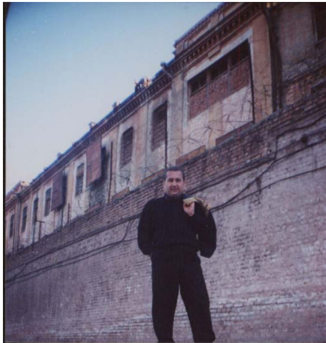
პატიმრობის შემდეგ თბილისის ძველ, სამსაუკონოვან საგუბერნიო ციხესთან

დასჯილი ადამიანები იმ ჯოჯოხეთურ ყოფაშიც კი ლამაზები და სულით ამაღლებული კაცები იყვნენ. მაგრამ როგორი იყვნენ და როგორები არიან ის სახელმწიფო მოხელეები, რომელთა კისერზეც ამდენი უსამართლოდ დასჯილი ადამიანის ცოდვა ჰკიდია?