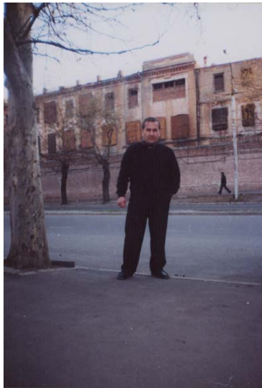
ორთაჭალის ძველი ციხე და მისი ყოფილი პატიმარი

მე ვაღიარებ სექტანტებთან ჩემს იდეოლოგიურ წინააღმდეგობას, რომელიც სულიერების სფეროს განეკუთვნება და თეოლოგიური ხასიათისაა. მათთან ჩემი წინააღმდეგობა გამოწვეულია არა იმით, რომ ისინი იელღველები არიან, ისევე როგორც სხვები არიან ბაპტისტები, ორმოცდაათიანელები, ან კიდევ სხვა რაღაც გაუგებრობები, არამედ იმით, რომ ისინი არღვევენ ჩემი უფლისა და ჩემი ქვეყნის სხვათაგან დამოუკიდებელ, წმიდათწმიდა ინტერესებს. მე მხოლოდ მათი მავნებლური საქმიანობას ვამხილებ, რაც სიტყვის თავისუფლების კონსტიტუციით გათვალისწინებული უფლებაა; მაგრამ მე სწორედ ამ სამართლებრივი უფლების გამოყენებისათვის დავისაჯე. ასევე, სრული კანონიერი უფლება მქონდა საკუთარი პოზიციის საჯაროდ გამოხატვისა, რაც ჩემი მიტინგში მონაწილეობით განხორციელდა. შეიძლება თამამად ითქვას, რომ ეს მიტინგი სამშვიდობო ხასიათით, დემოკრატიული მოწოდებებითა და ცივილური ფორმებით საქართველოში ჩატარებული ყველა სხვა მიტინგისაგან გამორჩეული იყო.