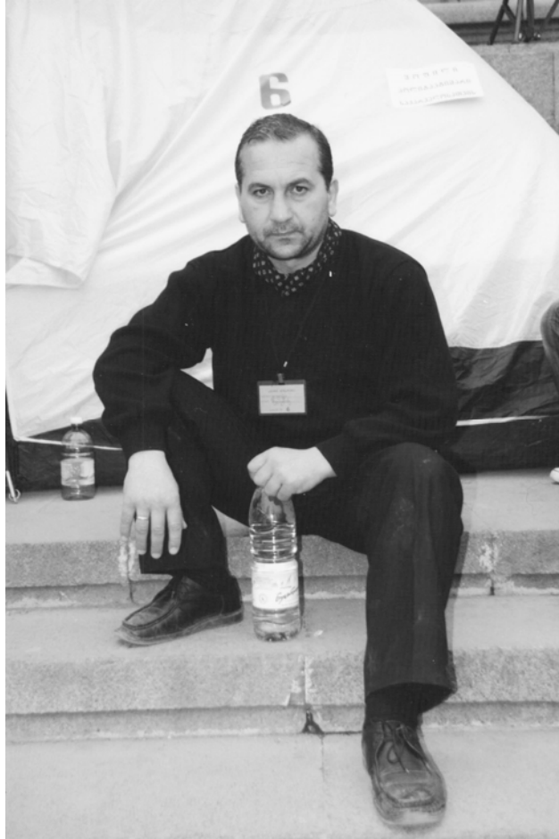
მოშიშხილეთა კარავი №6, რომელსაც ჰქონდა წარწერა: „ყოფილი პოლიტპატიმარი საქართველოსათვის“.

წუხელის გვიან დამეძინა და მერე ისეთ შემკრთალსა და დაფეთებულს გამეღვიძა, რომ თითქოს არც მიძინებოდა. ძილში ნანახი ცხადს იმდენად ძალიან წააგავდა, რომ მას სიზმარი არც კი ეთქმოდა, თუმცა მაინც სიზმარი იყო, რადგან ეს ყოველივე სწორედ ძილში ვიხილე: