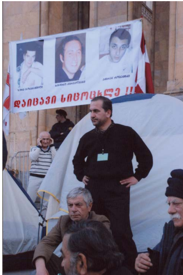
შიმშილობის საპროტესტო აქცია პარლამენტის შენობის წინ

შევამჩნიე, რომ ჩვენი კარვების ქალაქთან შეჯგუფებული ხალხი ზევით პარლამენტის შენობისკენ იყურებოდა, იქ ვიღაცას მუჭებს უქნევდა და ხმამაღალ წყევლა-კრულვას უგზავნიდა. ჩავთვალე, რომ ეს ხელისუფლებაზე გაბრაზებული ხალხის სახელისუფლებო შენობისაკენ მიმართული ზოგადი