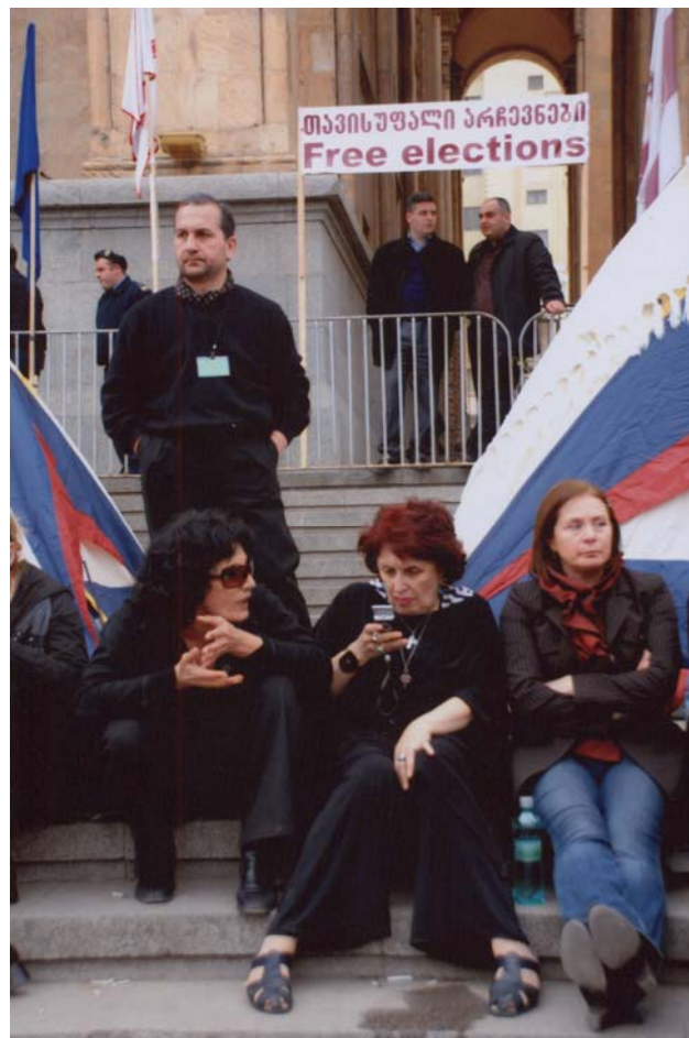
საზოგადოება მხარს უჭერს შიმშილობის საპროტესტო აქციას

– შორიდან დაგინახე და გამიხარდა, რომ აქ დგახარ. მართალი გითხრა, შენი აქ დგომა არ გამკვირვებია, რადგან აქ სწორედ შენისთანა კაცები უნდა იდგნენ. მომიტევე, რომ მეც შენს გვერდით ვერ ვარ. სამაგიეროდ რაკი შენ აქ მეგულები, ყოველ დღე მოვალ და ყოველდღე გეტყვი გამარჯობას, რათა მართლა გავიმარჯვოთ. მე და შენ კი არა, ჩვენმა სამშობლო ქვეყანამ გაიმარჯვოს, და თუ კი ქვეყანა გაიმარჯვებს, მაშინ ჩვენისთანა კაცები თავისთავად გამარჯვებულები იქნებიან.