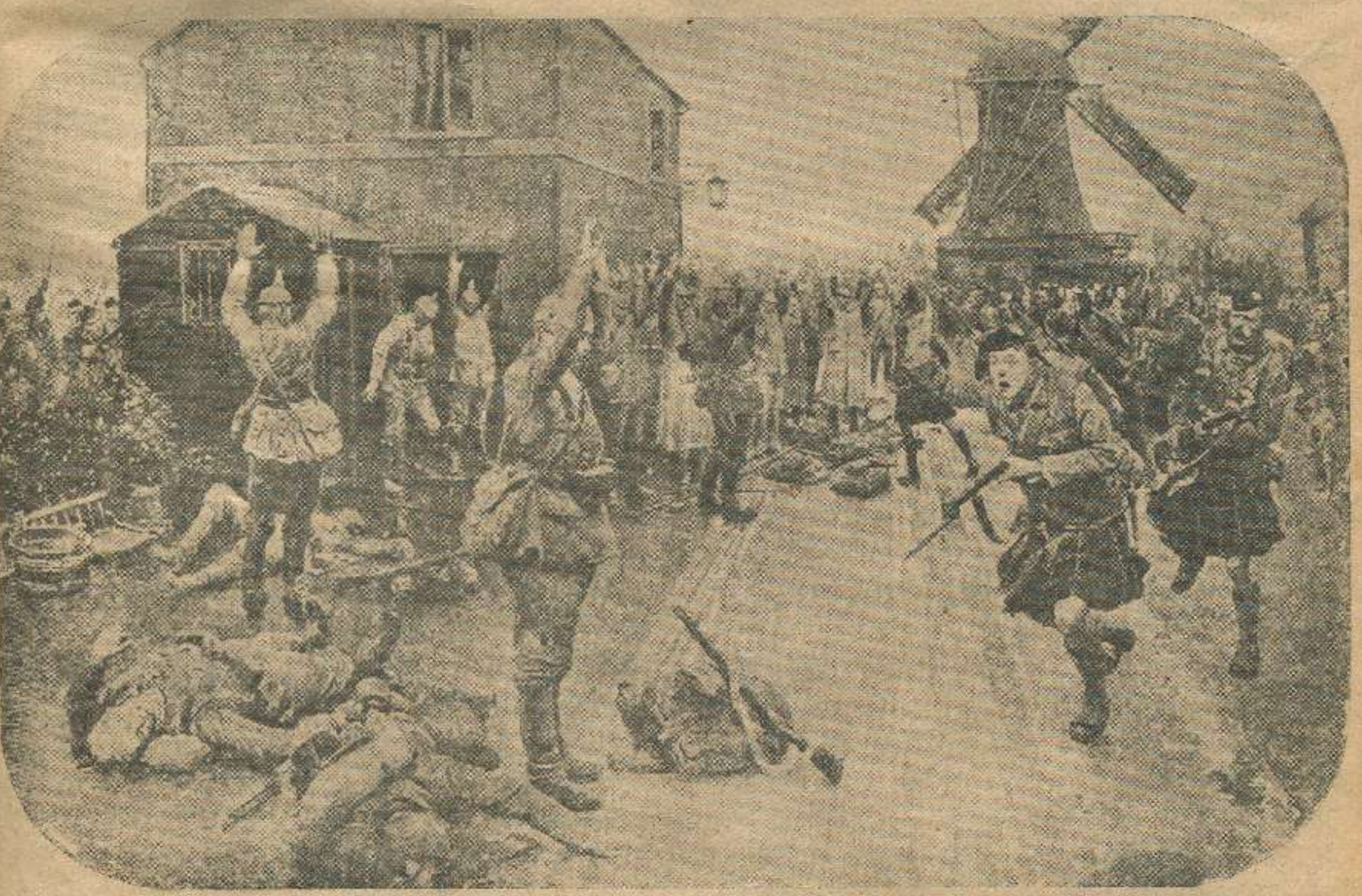
შოტლანდიელები ატყვევებენ გერმანელ რაზმსა.

მისამართი: თბილისი, Габაевский пер. № 3 რედაქცია „კლდე“. დეპუტისა: თბილისი კლდე.