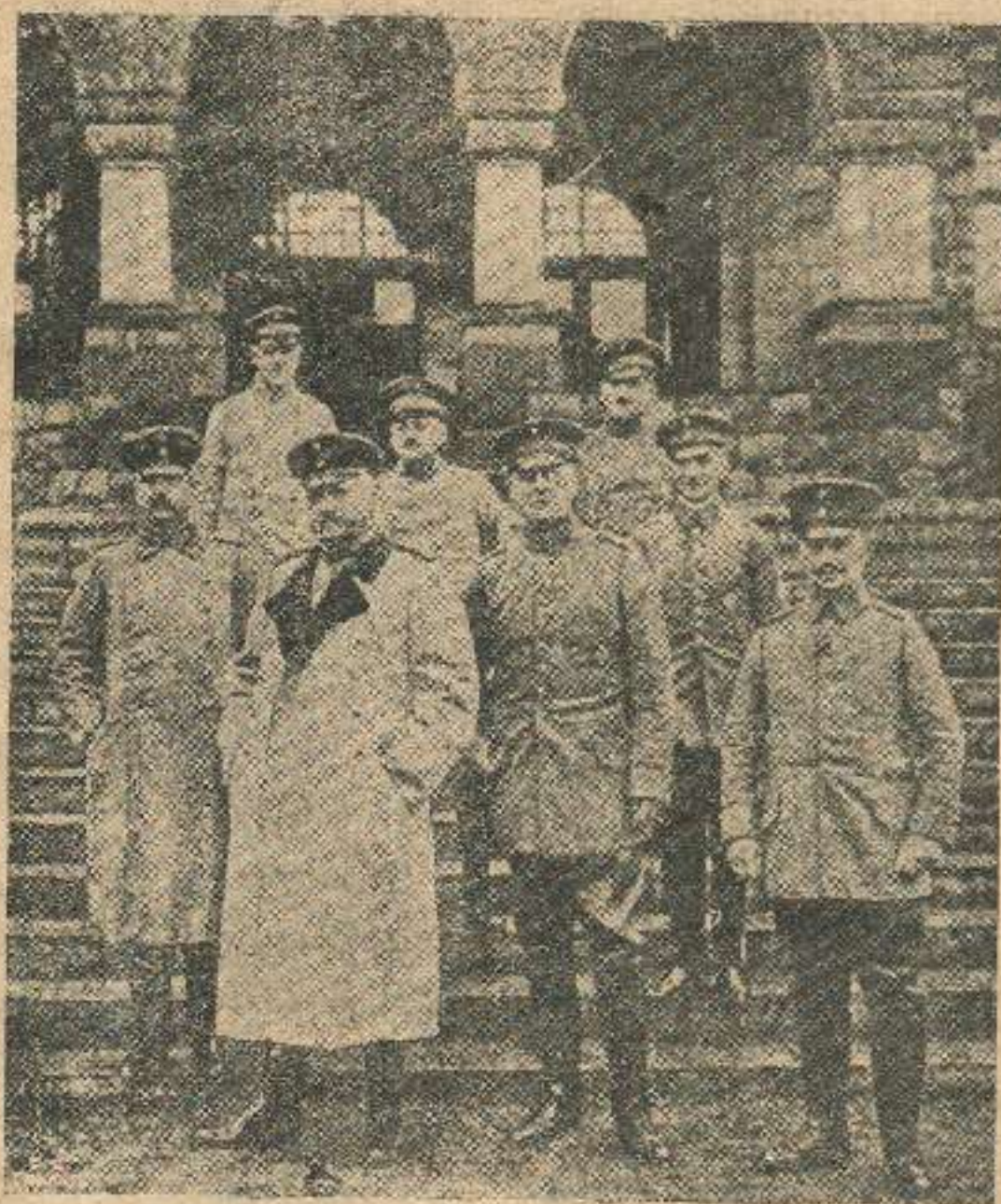
დენერალი გინდენბურგი და მისი შტაბი პოლონეთში